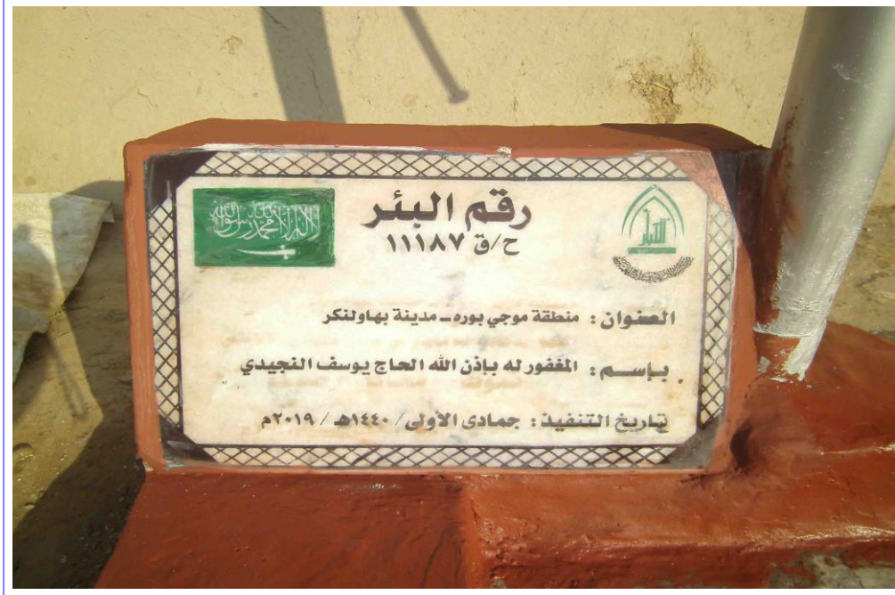
صورة عن قرب للوحة