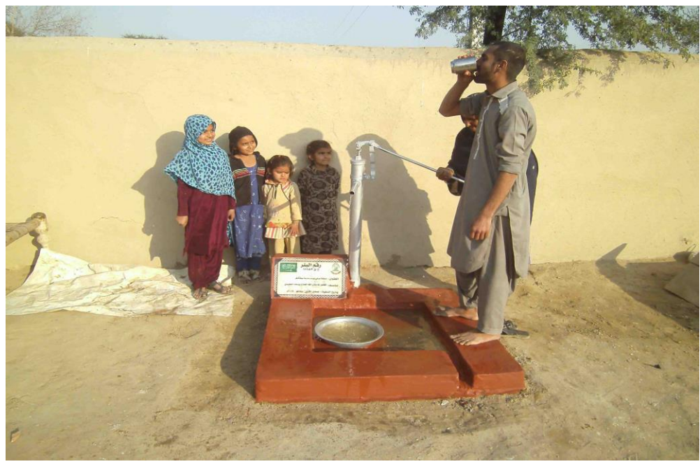
صورة للبئر مع المستخدمين من المشروع وهم يشربون من ماء البئر