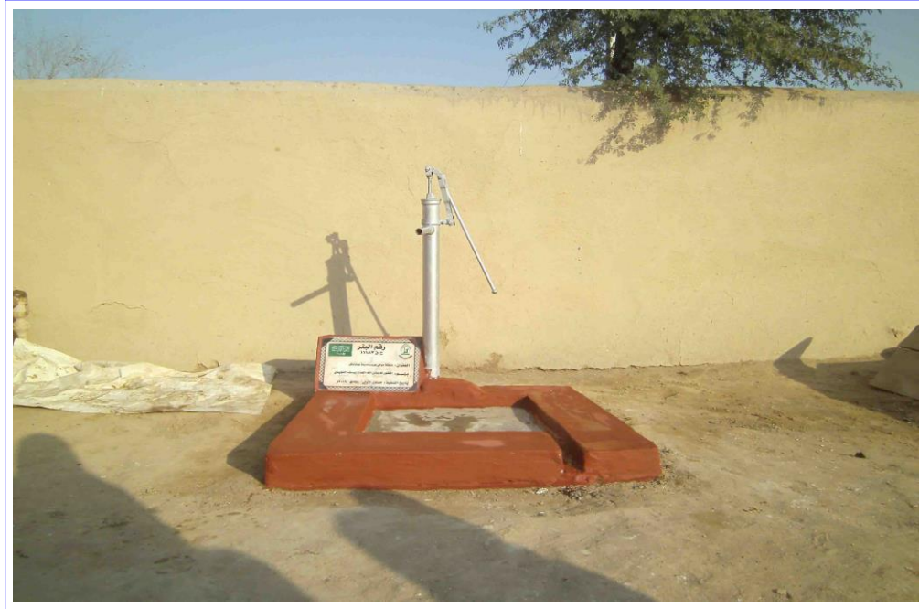
صورة عن قرب للبئر مع اللوحة