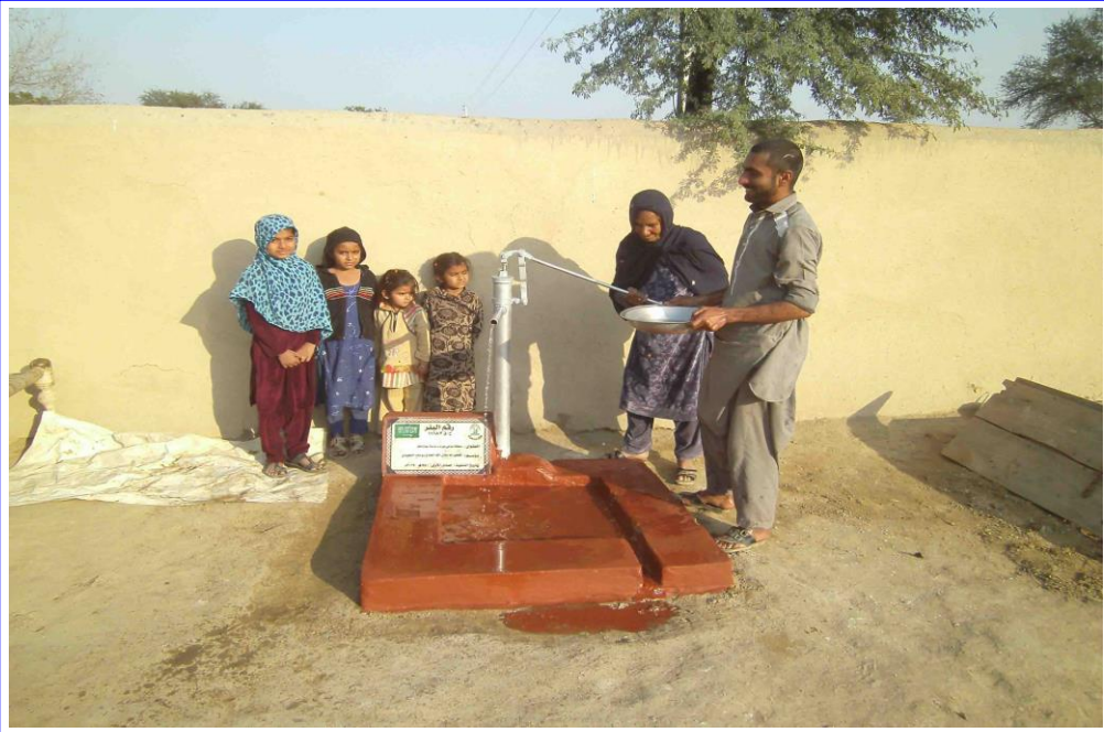
صورة أخرى للبئر مع المستخدمين من المشروع وهم يعيئون أوانيهم من ماء البئر