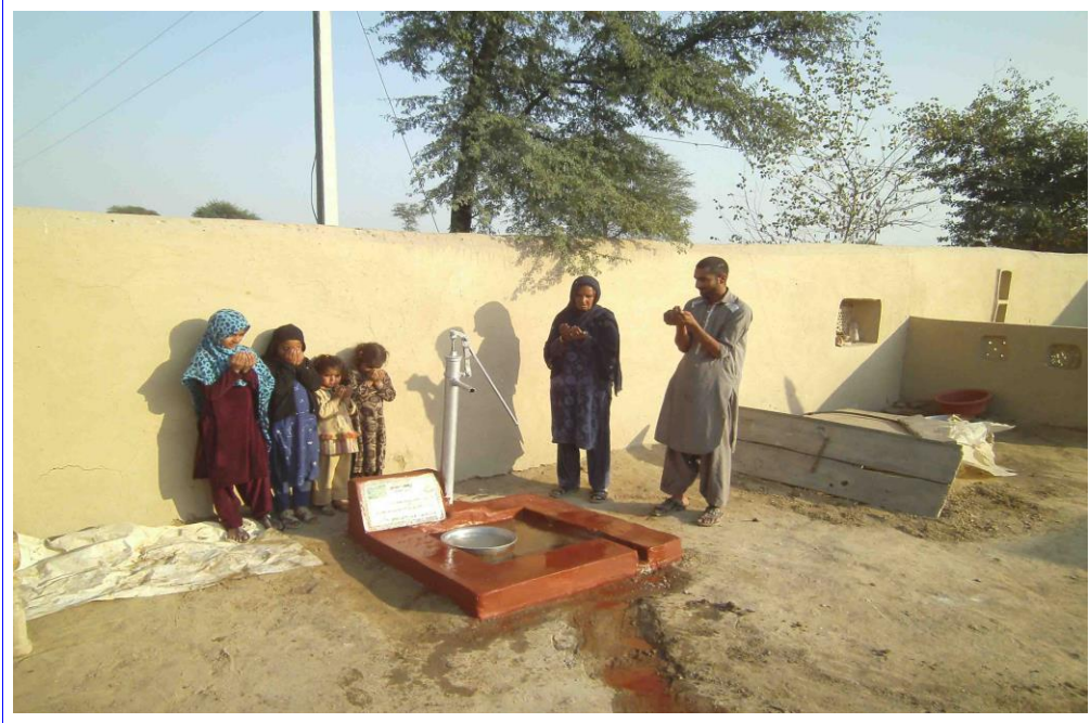
صورة أخرى للبئر مع المستفيدين من المشروع وهم يدعون للمرحوم بإذن الله بالمغفرة والرحمة