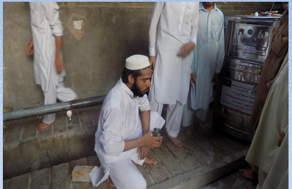
تقرير ختامي مشروع برادة ماء وقف لمسجد باسم / فاعل خير (٣) (ق/م، ١٣٠)