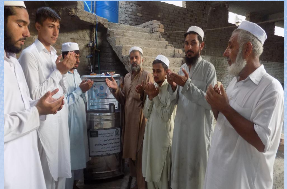
تقرير ختامي مشروع برادة ماء وقف لمسجد باسم / فاعل خير (٢) (ق/م ١٢٠)