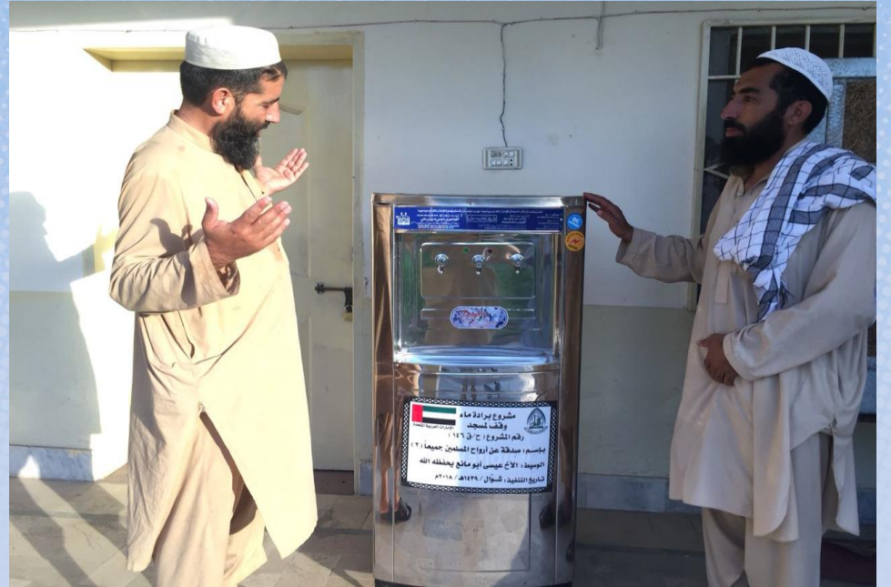
تقرير ختامي مشروع برادة ماء وقف لمسجد باسم / صدقة عن أرواح المسلمين جميعاً (٣) (م/ق ١٤٦)