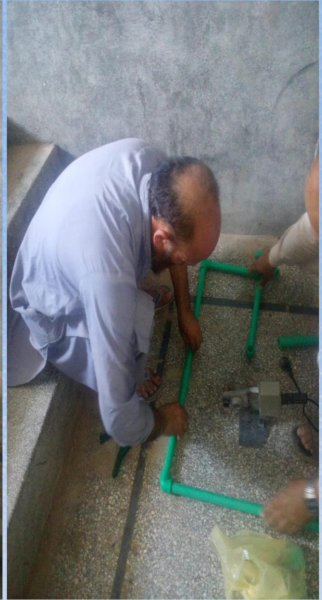
تقرير ختامي مشروع برادة ماء وقف لمسجد باسم / صدقة عن أرواح المسلمين جميعاً (٣) (م/ق ١٤٦)