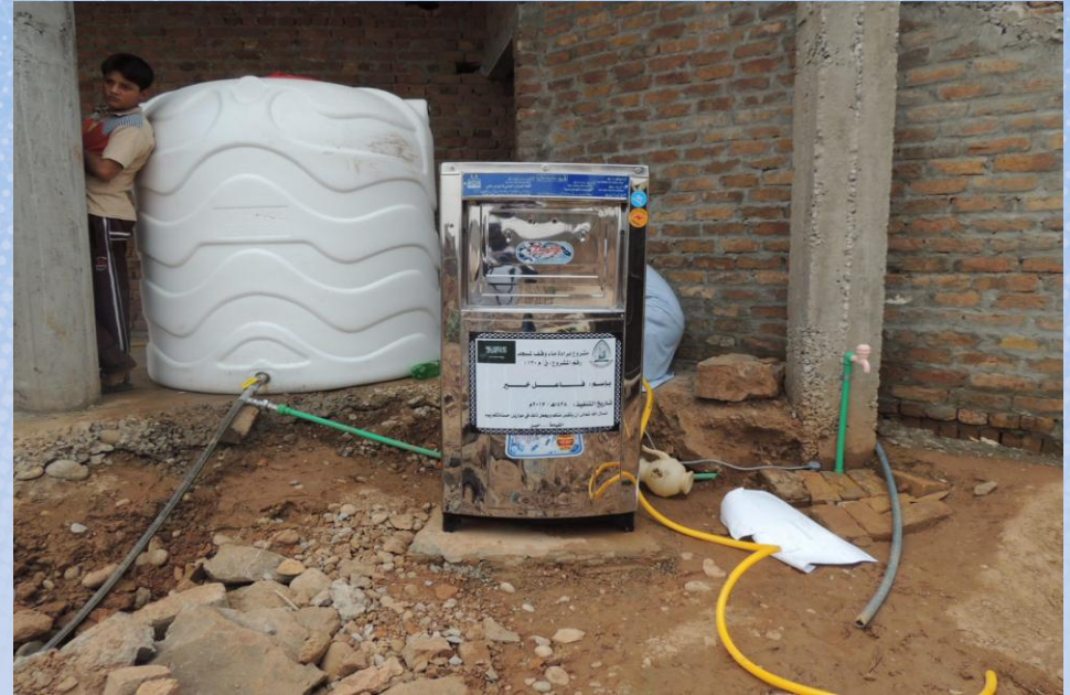
تقرير ختامي مشروع برادة ماء وقف لمسجد باسم / فاعل خير (ق/م ١٣٠)