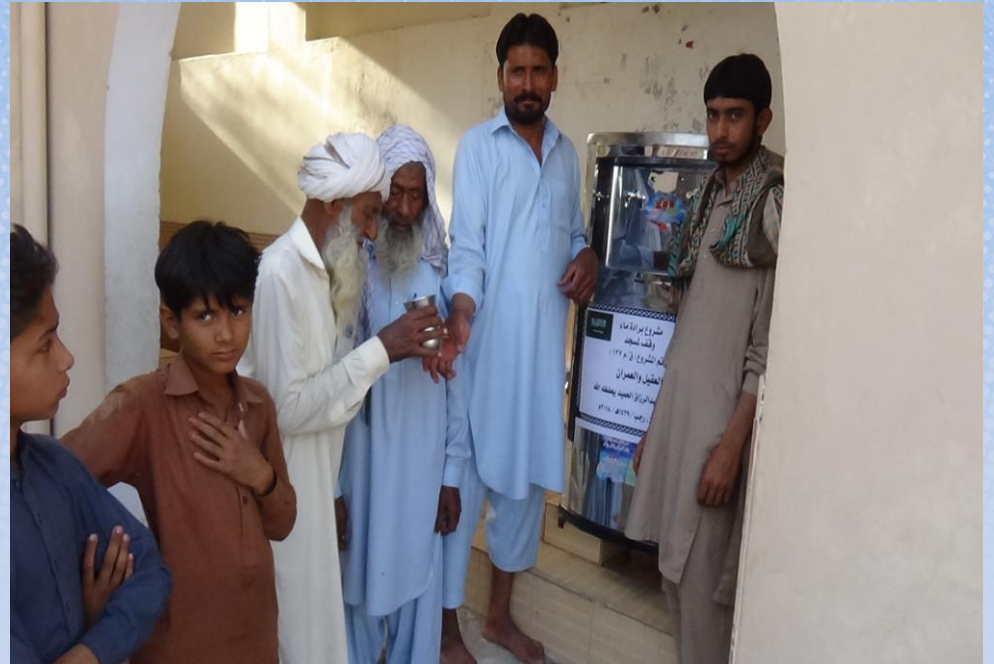
تقرير ختامي مشروع برادة ماء وقف لمسجد باسم / العقيل والعمران (ق/م ١٣٧)