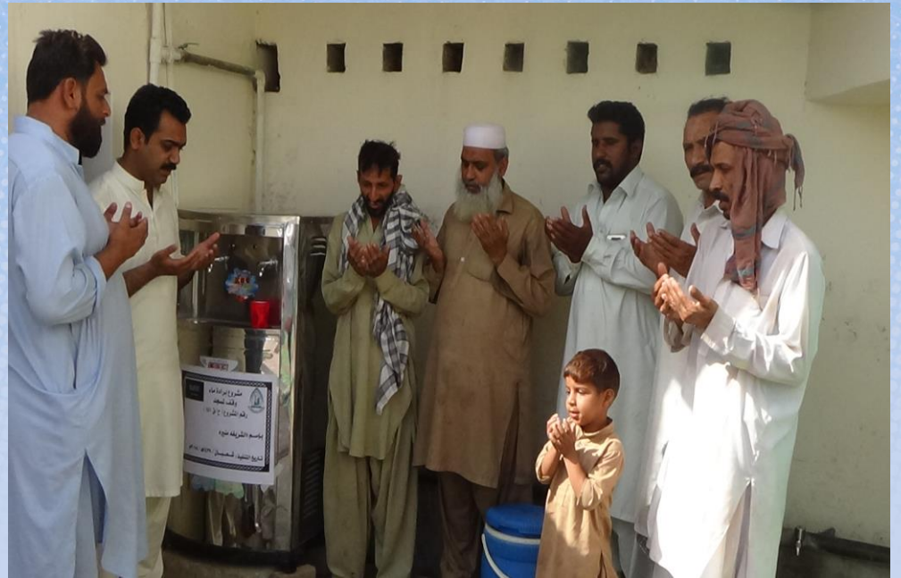
تقرير ختامي مشروع برادة ماء وقف لمسجد باسم / الشريفه منيره (ح/ق ١٤١)