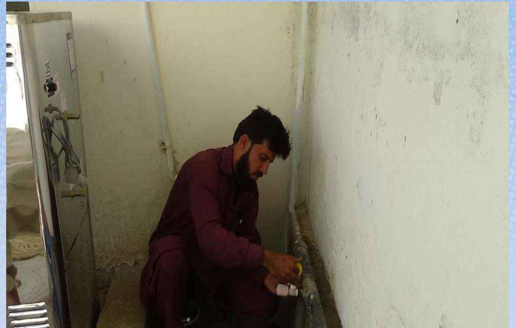
تقرير ختامي مشروع برادة ماء وقف لمسجد باسم / الشريعة منيره (ح/ق ١٤١)