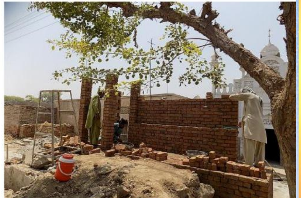
تقریر ختامي حفر بئر باسم / الأّم سعيد بن محمد رحمة الله عليه (ق/م ك 0٠٤٠)