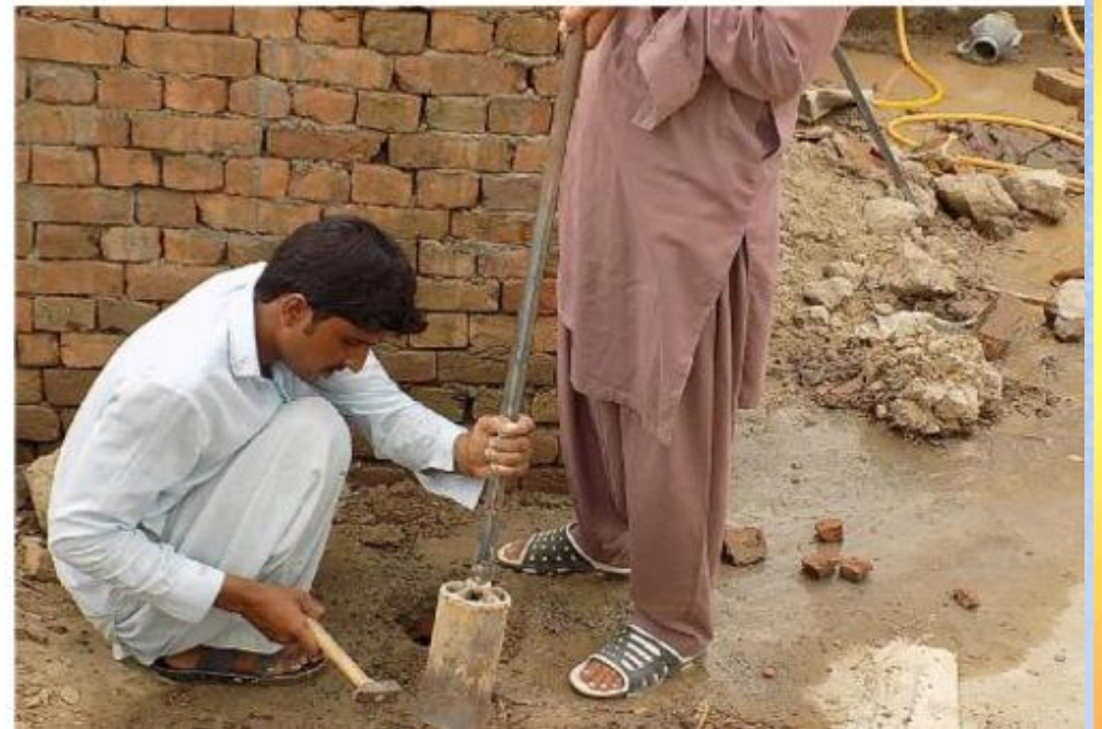
تقریر ختامي حفر بئر باسم / الأّم سعيد بن محمد رحمة الله عليه (ق/م ك 0٠٤٠)