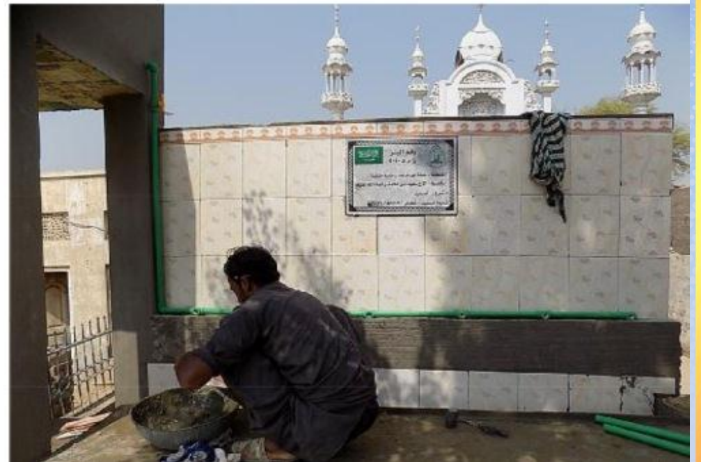
تقریر ختامي حفر بئر باسم / الأّم سعيد بن محمد رحمة الله عليه (ق/م ك 0٠٤٠)