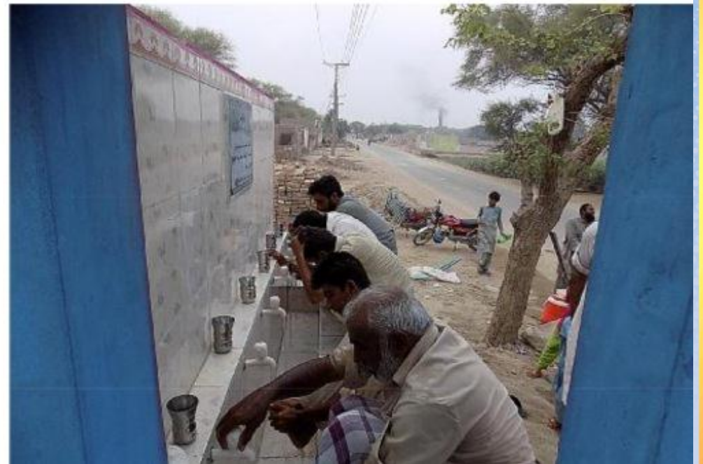
تقریر ختامي حفر بئر باسم / الأخر سعيد بن محمد رحمة الله عليه (ق/م ك ٥٠٤٠)