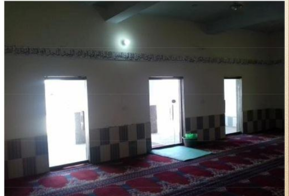
مشروع بناء بيت في الجنة / مسجد الصديق (ق/م ١٦٣)