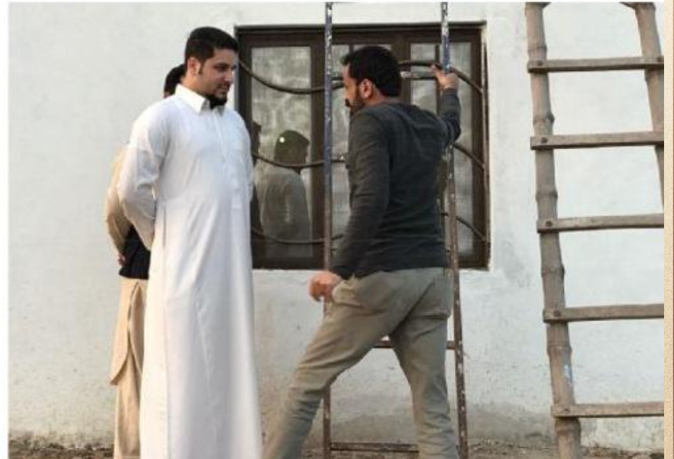
مشروع بناء بيت في الجنة / مسجد الصديق (ق/م ١٦٣)