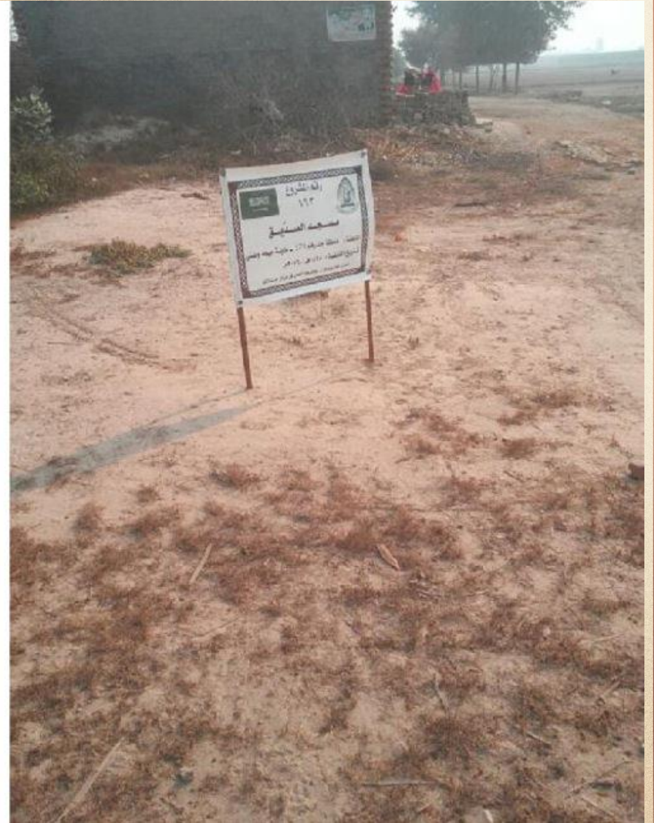
مشروع بناء بيت في الجنة / مسجد الصديق (ق/م ١٦٣)