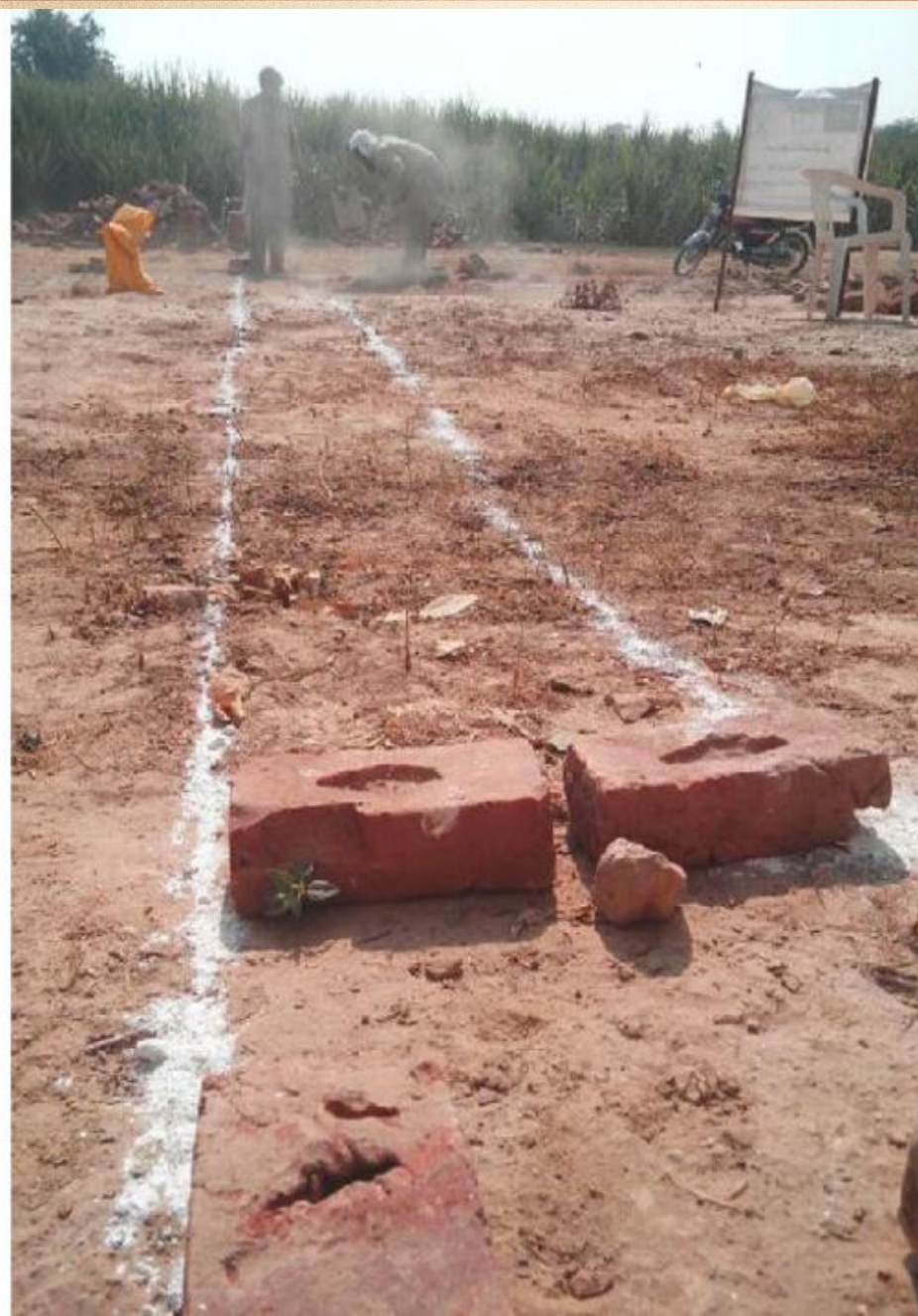
مشروع بناء بيت في الجنة / مسجد الصديق (ق/م ١٦٣)