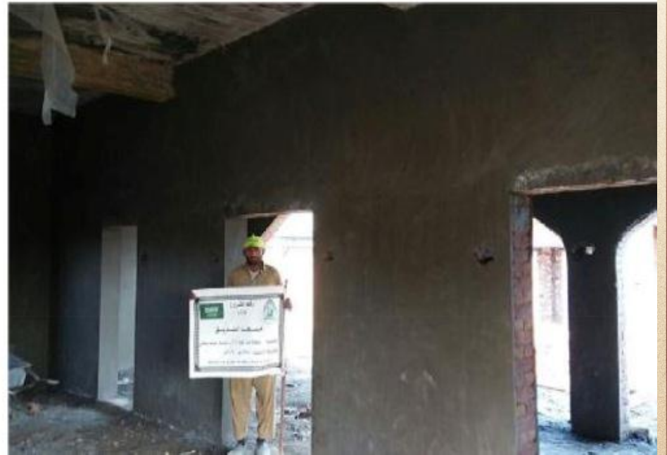
مشروع بناء بيت في الجنة / مسجد الصديق (ق/م ١٦٣)