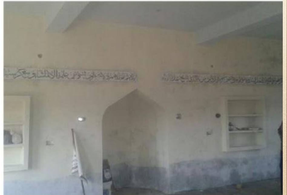
مشروع بناء بيت في الجنة / مسجد الصديق (ق/م ١٦٣)