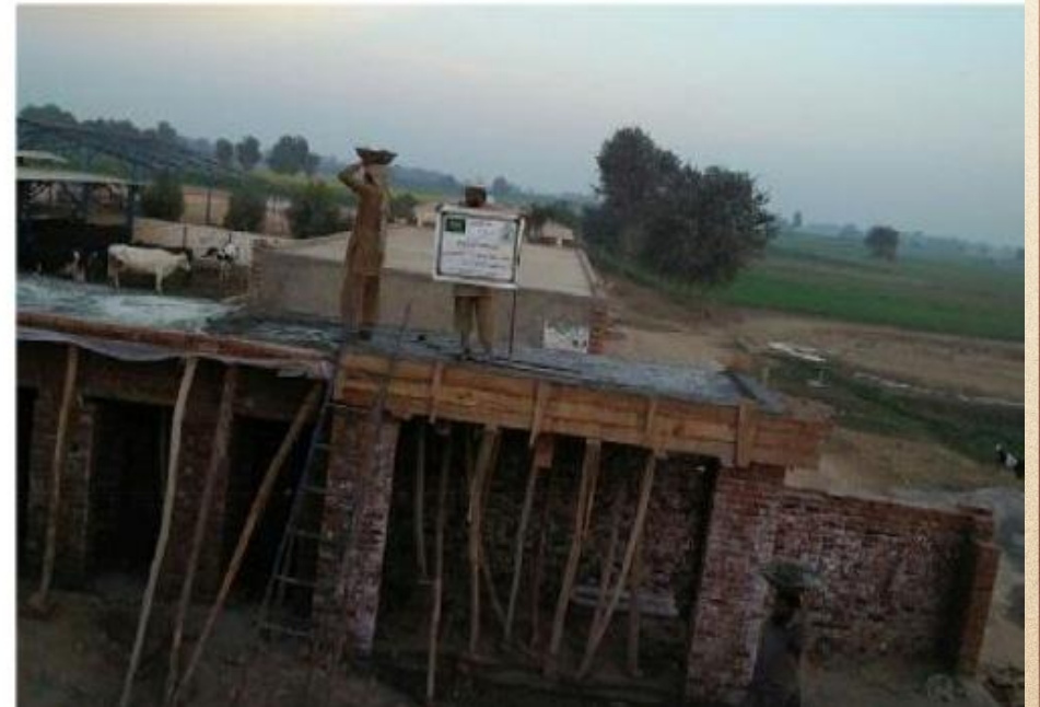
مشروع بناء بيت في الجنة / مسجد الصديق (ق/م ١٦٣)