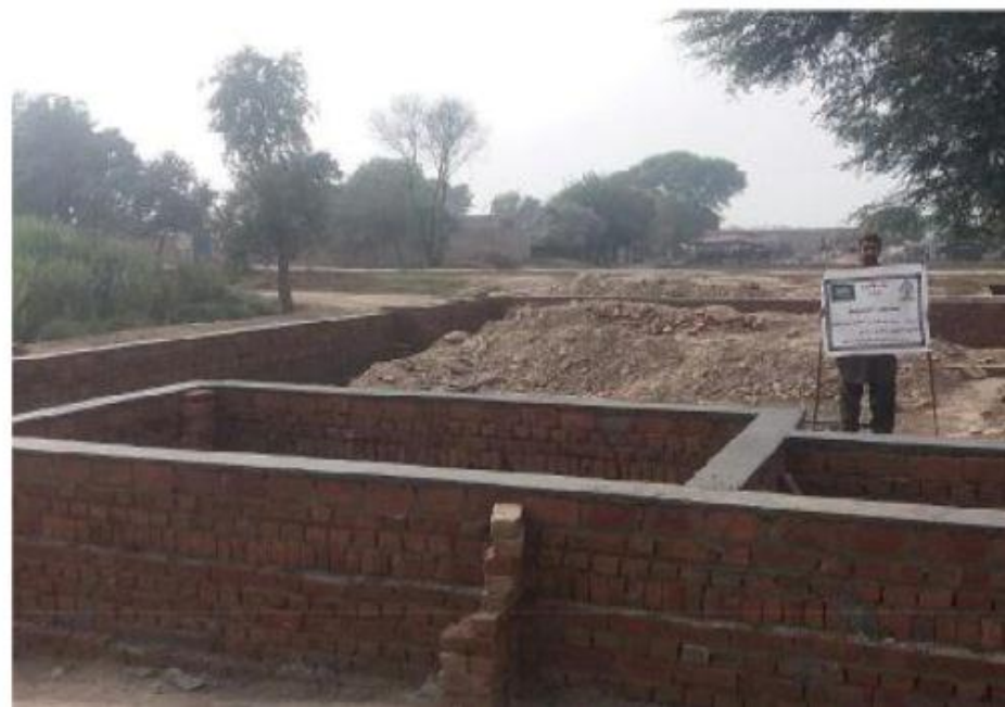
مشروع بناء بيت في الجنة / مسجد الصديق (ق/م ١٦٣)