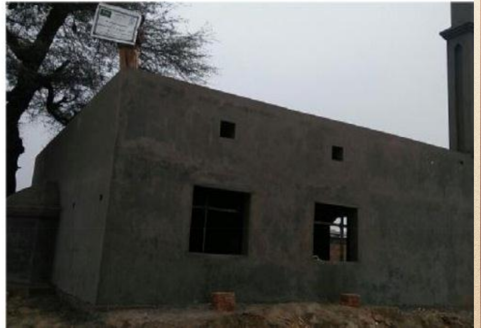
مشروع بناء بيت في الجنة / مسجد الصديق (ق/م ١٦٣)