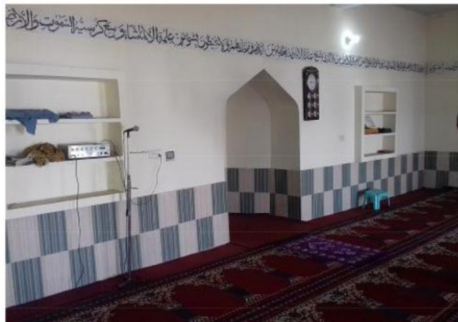
مشروع بناء بيت في الجنة / مسجد الصديق (ق/م ١٦٣)