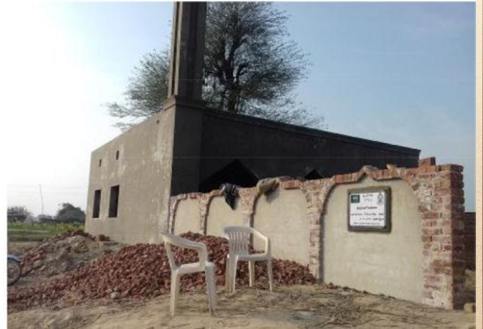
مشروع بناء بيت في الجنة / مسجد الصديق (ق/م ١٦٣)