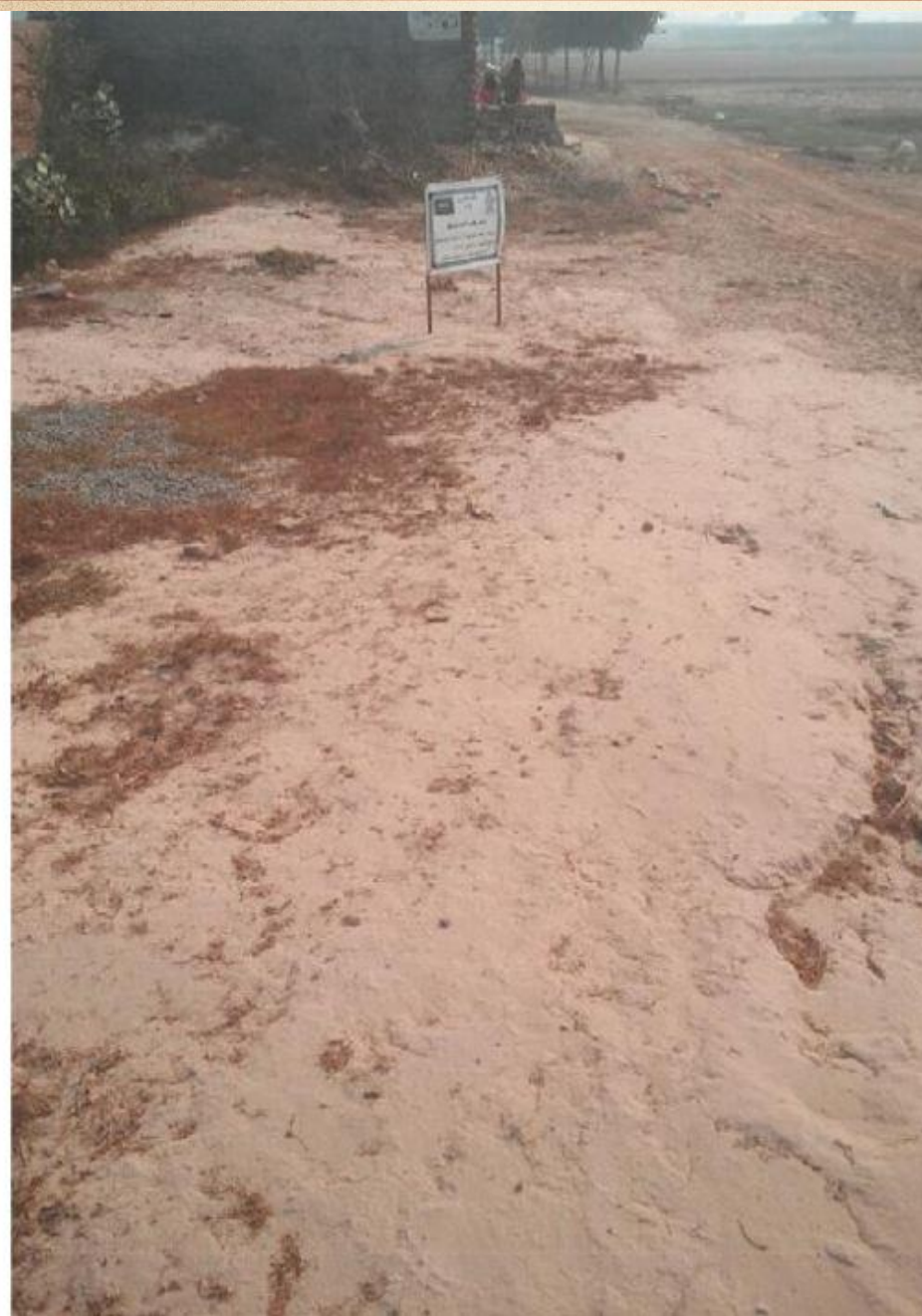
مشروع بناء بيت في الجنة / مسجد الصديق (ق/م ١٦٣)