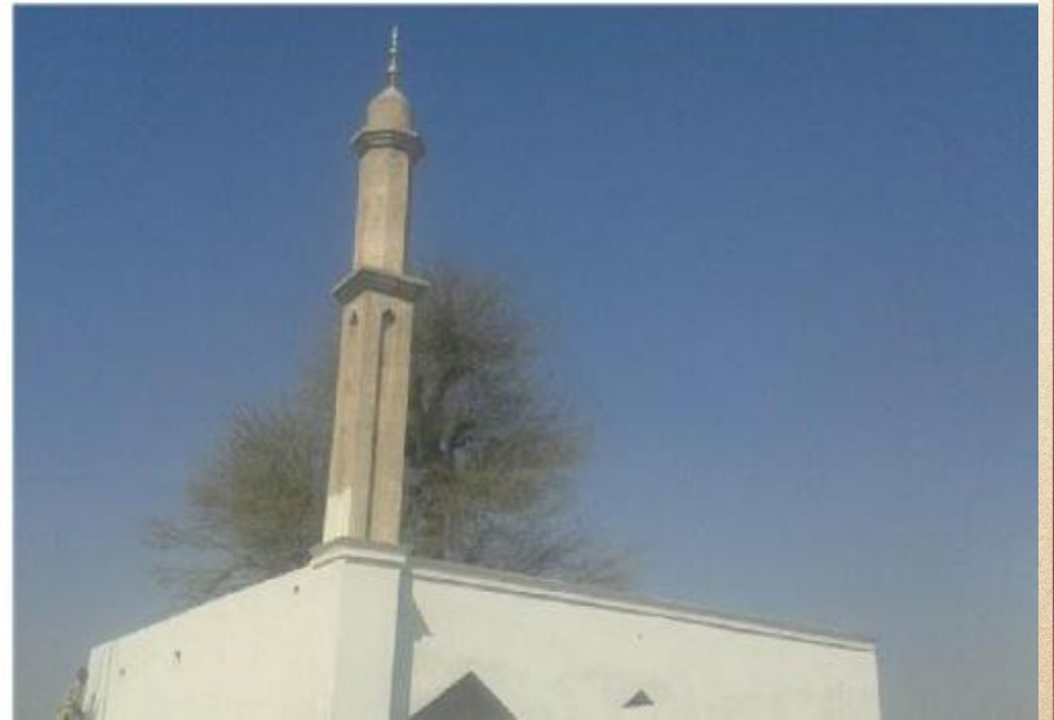
مشروع بناء بيت في الجنة / مسجد الصديق (ق/م ١٦٣)