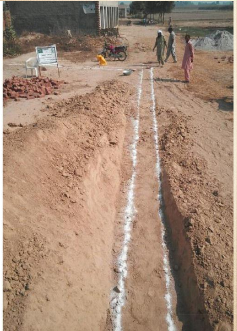
مشروع بناء بيت في الجنة / مسجد الصديق (ق/م ١٦٣)