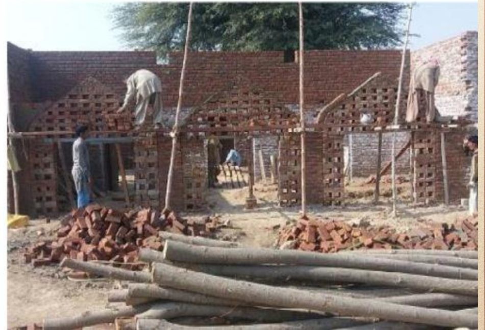
مشروع بناء بيت في الجنة / مسجد الصديق (ق/م ١٦٣)