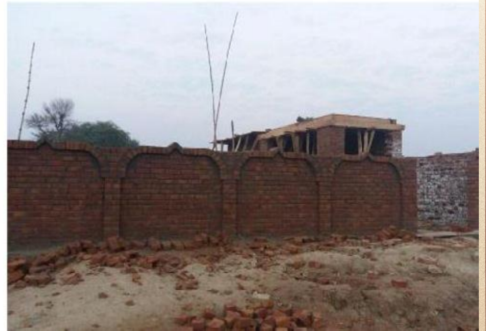
مشروع بناء بيت في الجنة / مسجد الصديق (ق/م ١٦٣)