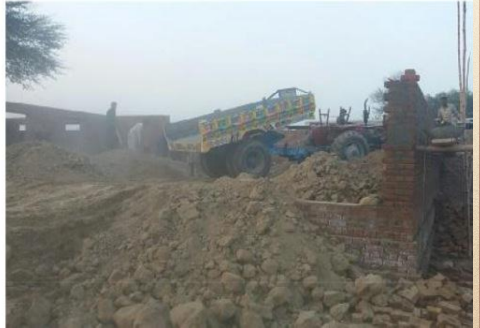
مشروع بناء بيت في الجنة / مسجد الصديق (ق/م ١٦٣)