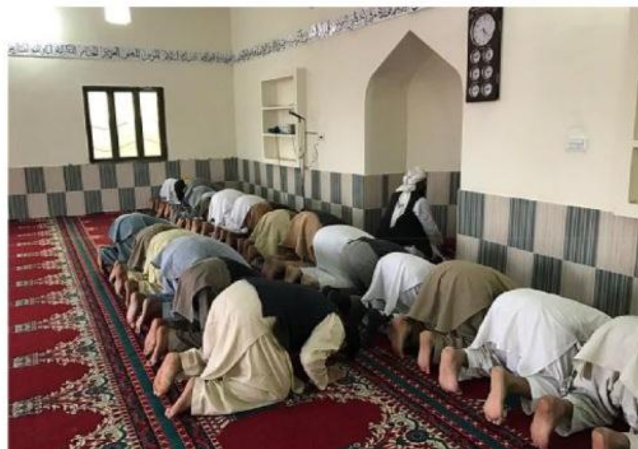
مشروع بناء بيت في الجنة / مسجد الصديق (ق/م ١٦٣)