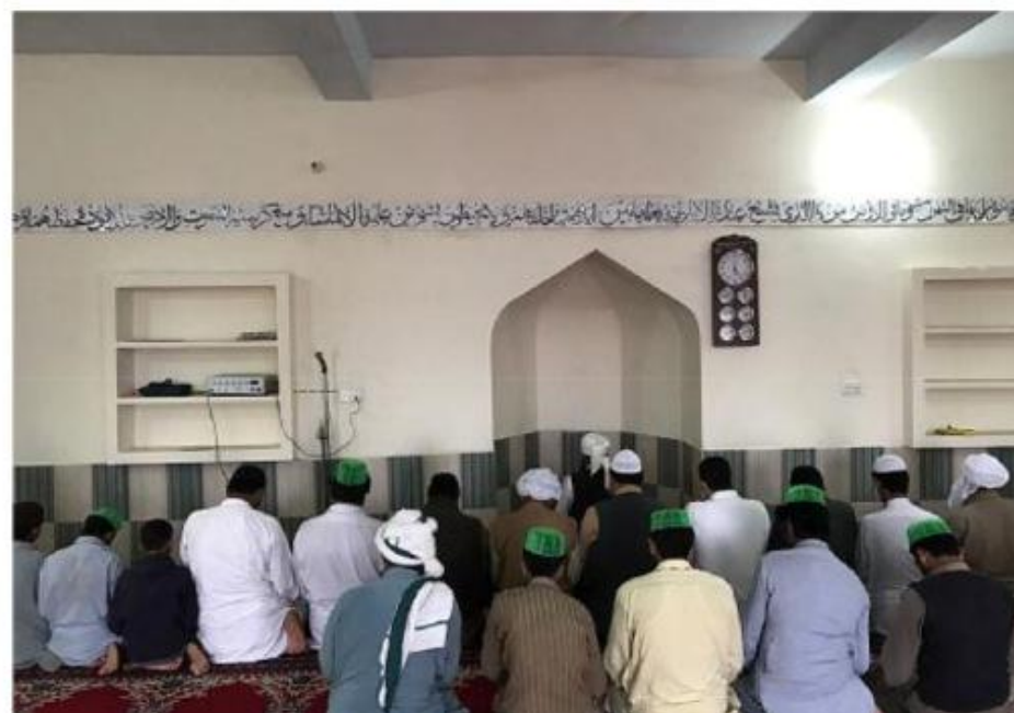
مشروع بناء بيت في الجنة / مسجد الصديق (ق/م ١٦٣)