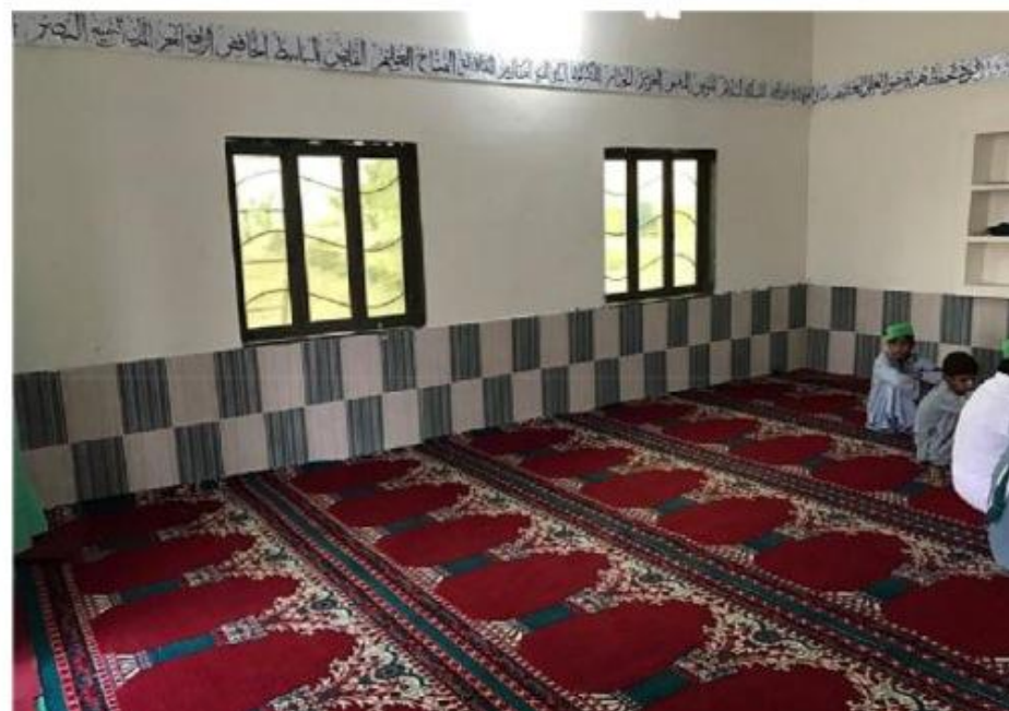
مشروع بناء بيت في الجنة / مسجد الصديق (ق/م ١٦٣)