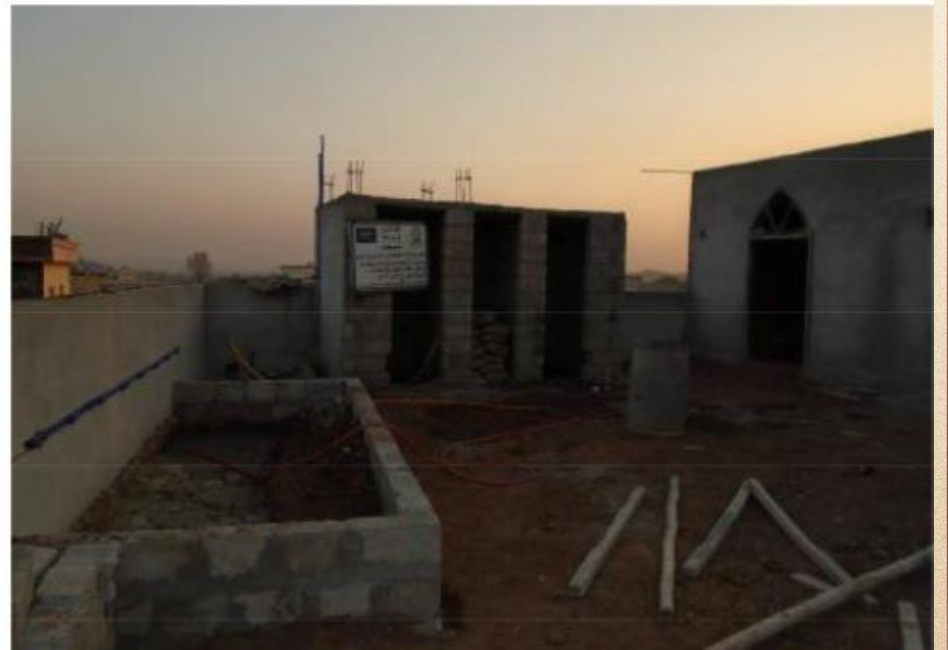
مشروع بناء بيت في الجنة / مسجد المغفور له بإذن الله الشيخ خالد بن زابن المرزوقي البقمي (ق/م ٢٧٠)