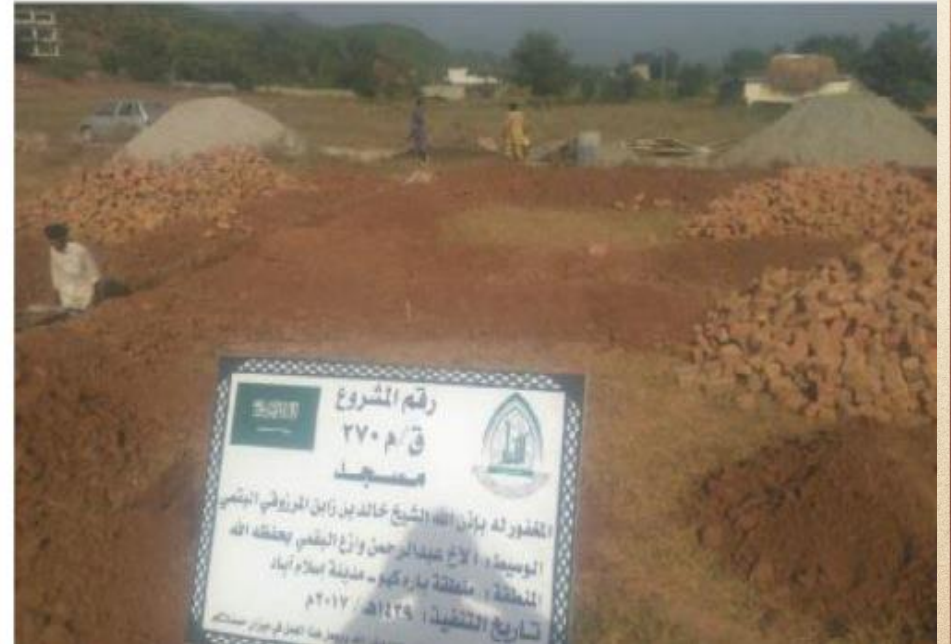
مشروع بناء بيت في الجنة / مسجد المغفور له بإذن الله الشيخ خالد بن زابن المرزوقي البقمي (ق/م ٢٧٠)