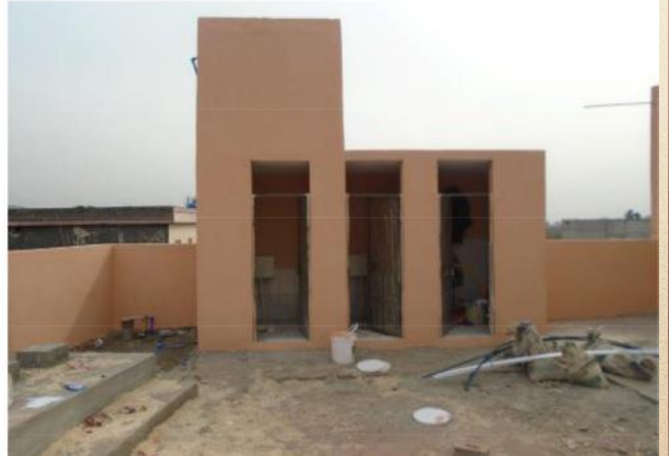
مشروع بناء بيت في الجنة / مسجد المغفور له بإذن الله الشيخ خالد بن زابن المرزوقي البقمي (ق/م ٢٧٠)