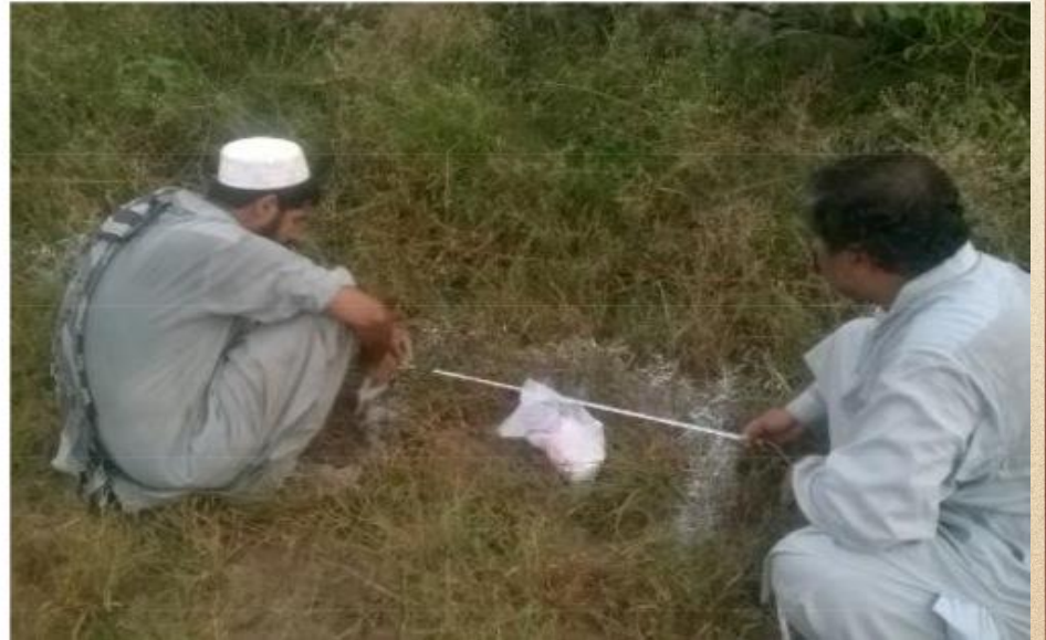
مشروع بناء بيت في الجنة / مسجد المغفور له بإذن الله الشيخ خالد بن زابن المرزوقي البقمي (ق/م ٢٧٠)