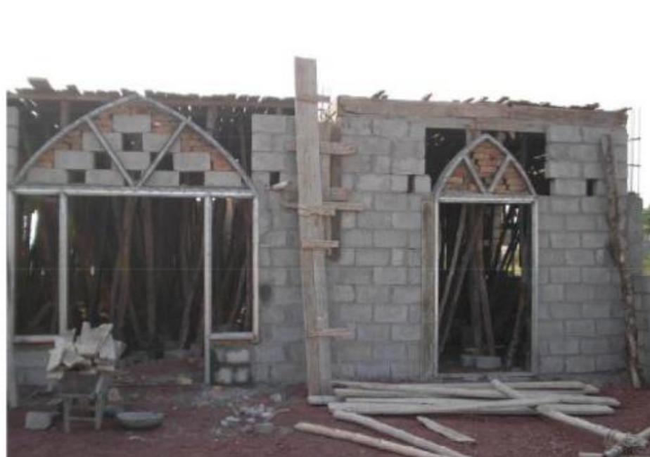
مشروع بناء بيت في الجنة / مسجد المغفور له بإذن الله الشيخ خالد بن زابن المرزوقي البقمي (ق/م ٢٧٠)