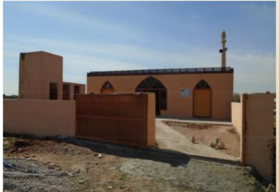
مشروع بناء بيت في الجنة / مسجد المغفور له بإذن الله الشيخ خالد بن زابن المرزوقي البقمي (ق/م ٢٧٠)