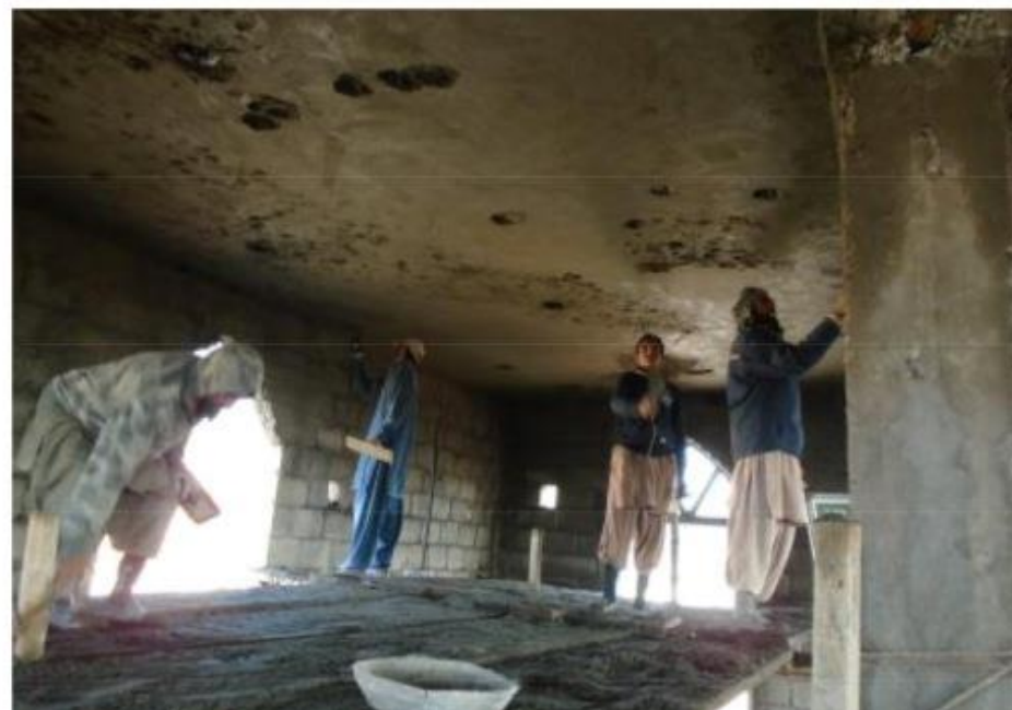
مشروع بناء بيت في الجنة / مسجد المغفور له بإذن الله الشيخ خالد بن زابن المرزوقي البقمي (ق/م ٢٧٠)