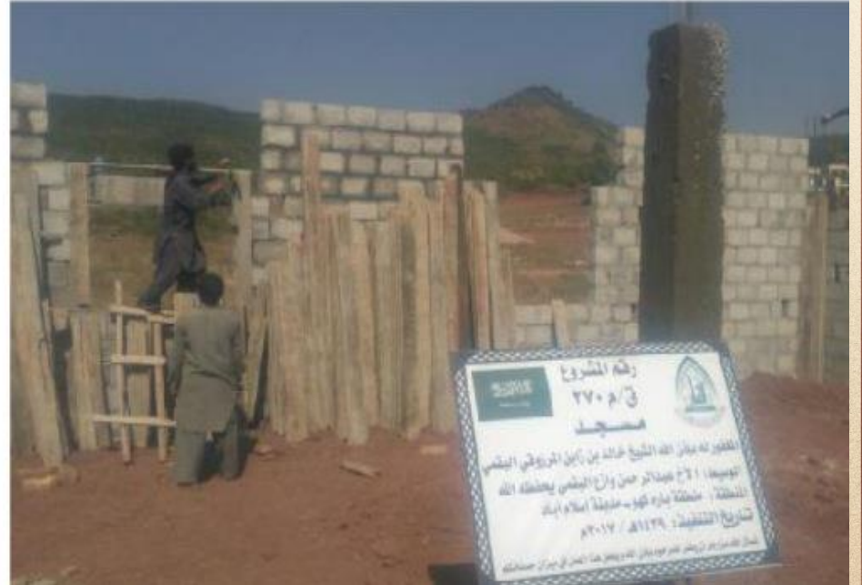
مشروع بناء بيت في الجنة / مسجد المغفور له بإذن الله الشيخ خالد بن زابن المرزوقي البقمي (ق/م ٢٧٠)