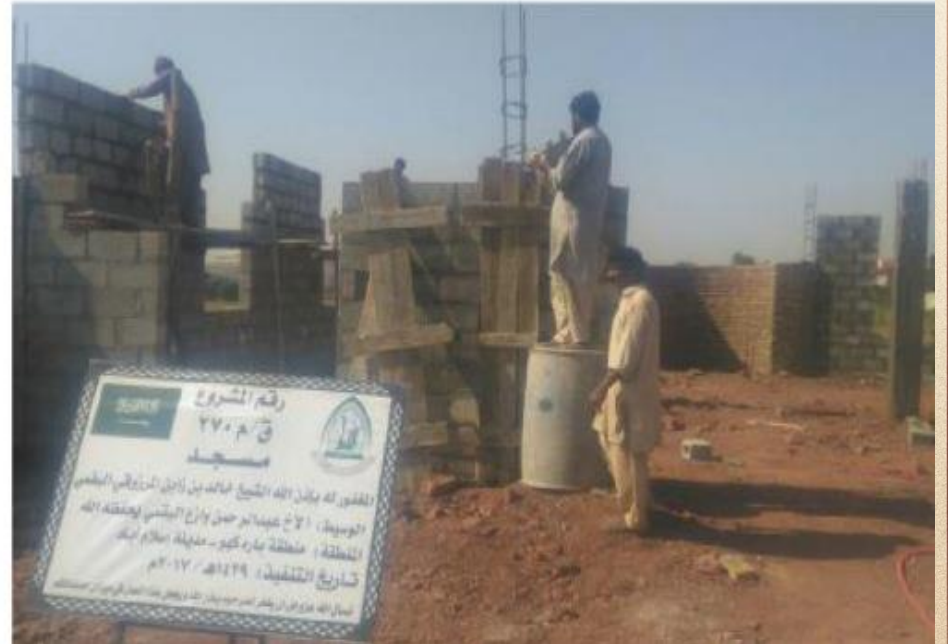
مشروع بناء بيت في الجنة / مسجد المغفور له بإذن الله الشيخ خالد بن زابن المرزوقي البقمي (ق/م ٢٧٠)