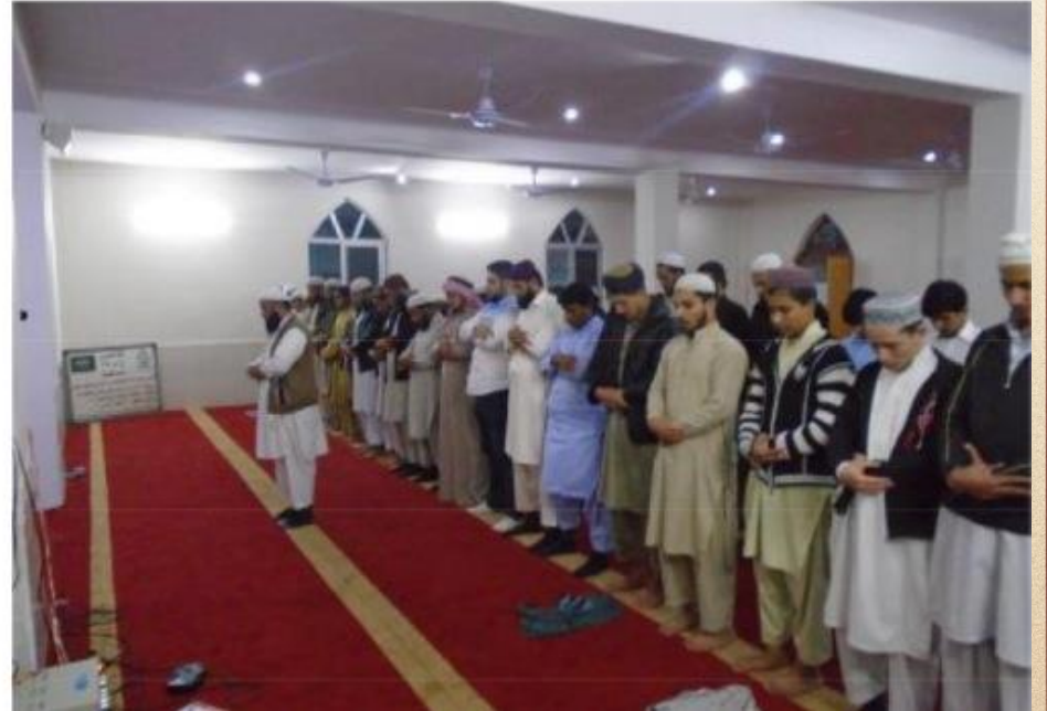
مشروع بناء بيت في الجنة / مسجد المغفور له بإذن الله الشيخ خالد بن زابن المرزوقي البقمي (ق/م ٢٧٠)