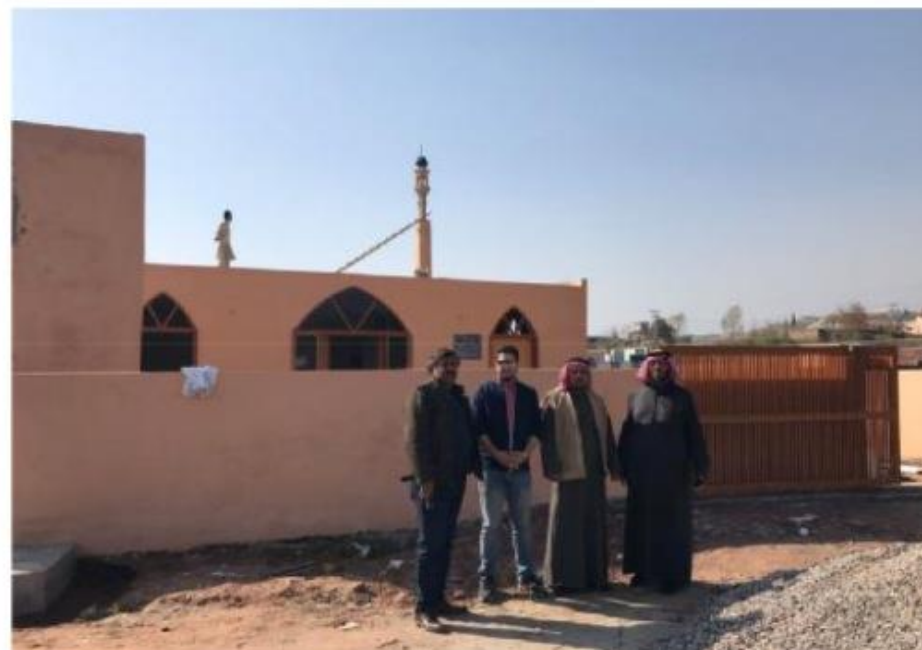
مشروع بناء بيت في الجنة / مسجد المغفور له بإذن الله الشيخ خالد بن زابن المرزوقي البقمي (ق/م ٢٧٠)