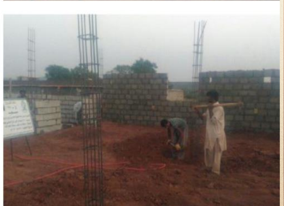
مشروع بناء بيت في الجنة / مسجد المغفور له بإذن الله الشيخ خالد بن زابن المرزوقي البقمي (ق/م ٢٧٠)