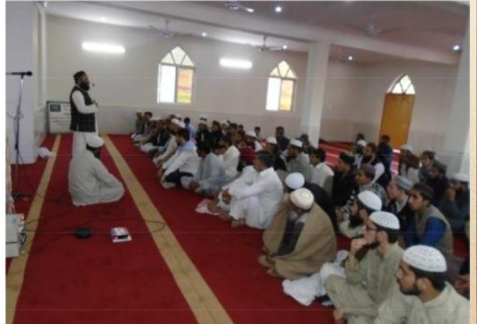
مشروع بناء بيت في الجنة / مسجد المغفور له بإذن الله الشيخ خالد بن زابن المرزوقي البقمي (ق/م ٢٧٠)