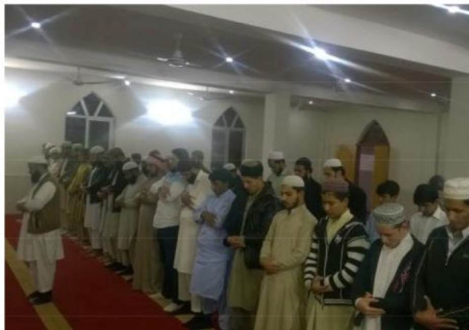
مشروع بناء بيت في الجنة / مسجد المغفور له بإذن الله الشيخ خالد بن زابن المرزوقي البقمي (ق/م ٢٧٠)