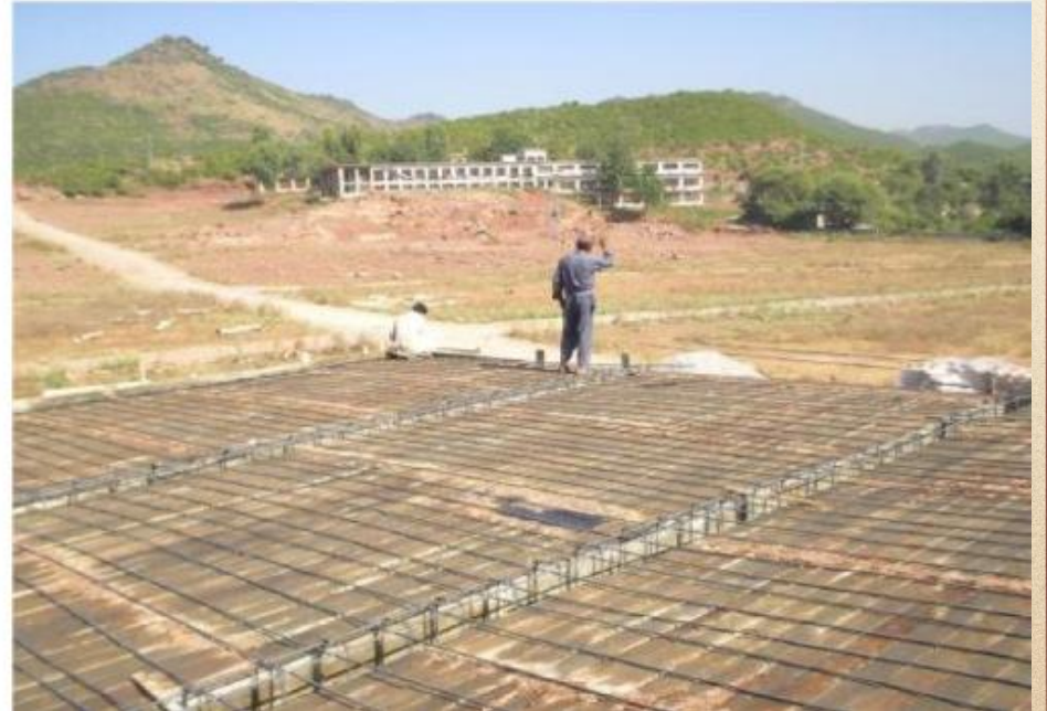
مشروع بناء بيت في الجنة / مسجد المغفور له بإذن الله الشيخ خالد بن زابن المرزوقي البقمي (ق/م ٢٧٠)