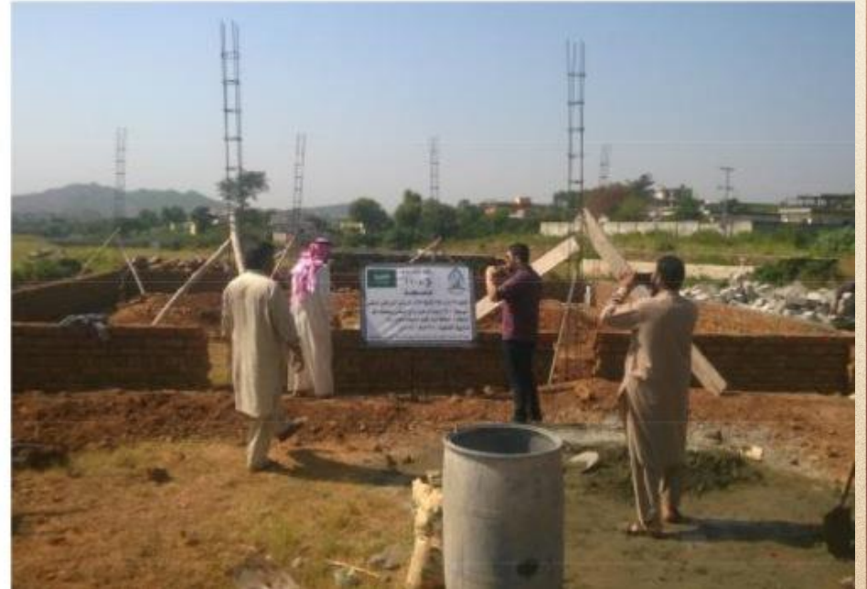
مشروع بناء بيت في الجنة / مسجد المغفور له بإذن الله الشيخ خالد بن زابن المرزوقي البقمي (ق/م ٢٧٠)