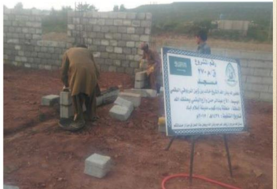
مشروع بناء بيت في الجنة / مسجد المغفور له بإذن الله الشيخ خالد بن زابن المرزوقي البقمي (ق/م ٢٧٠)