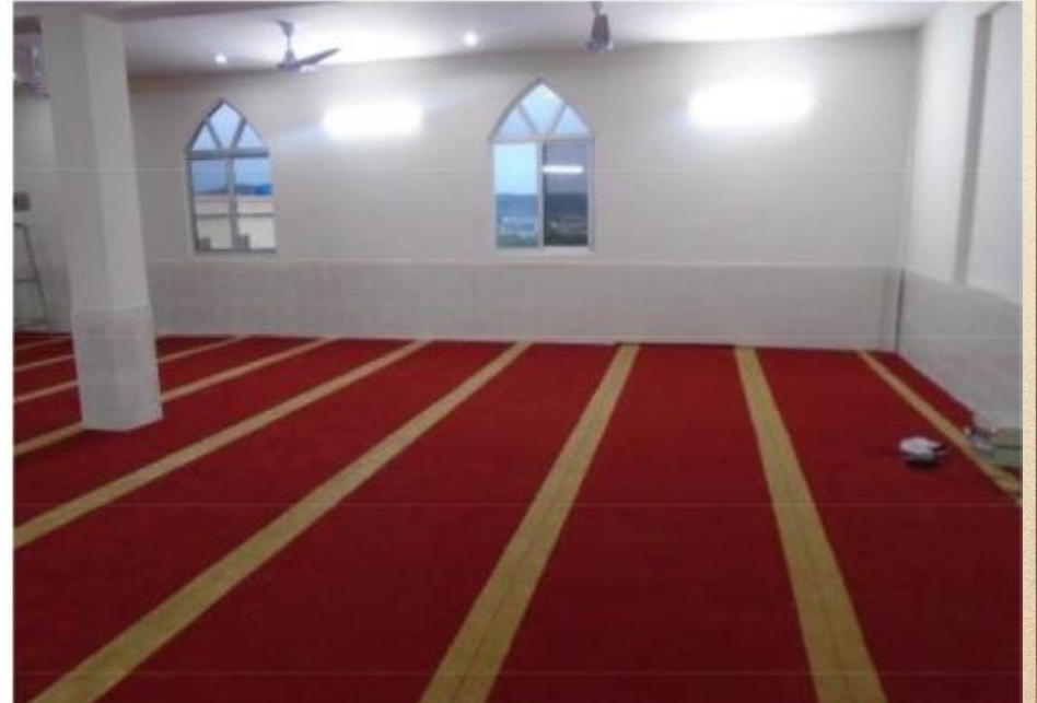
مشروع بناء بيت في الجنة / مسجد المغفور له بإذن الله الشيخ خالد بن زابن المرزوقي البقمي (ق/م ٢٧٠)