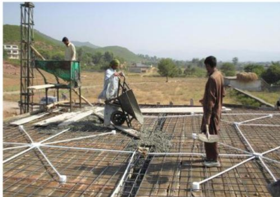
مشروع بناء بيت في الجنة / مسجد المغفور له بإذن الله الشيخ خالد بن زابن المرزوقي البقمي (ق/م ٢٧٠)