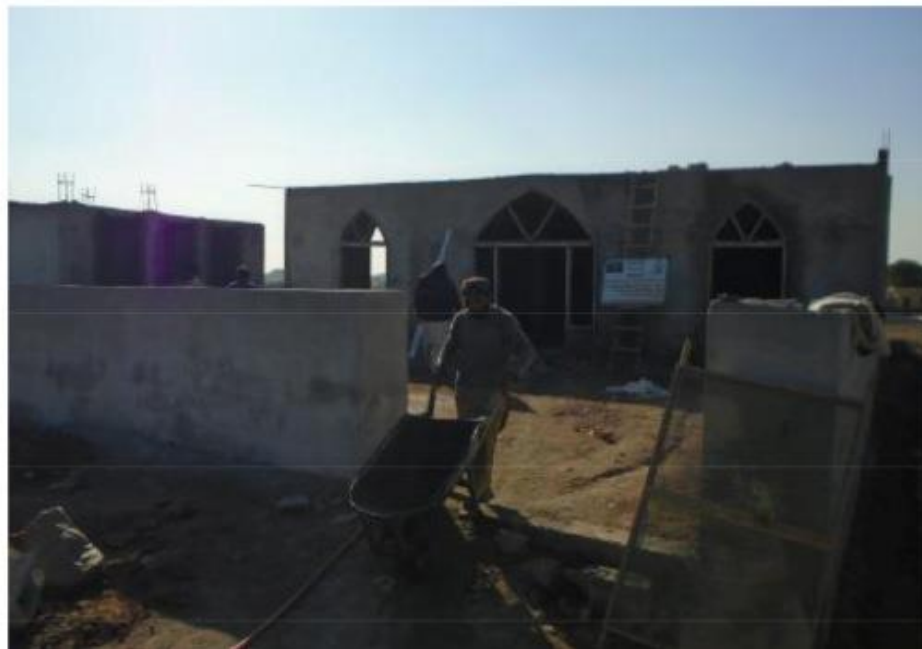
مشروع بناء بيت في الجنة / مسجد المغفور له بإذن الله الشيخ خالد بن زابن المرزوقي البقمي (ق/م ٢٧٠)