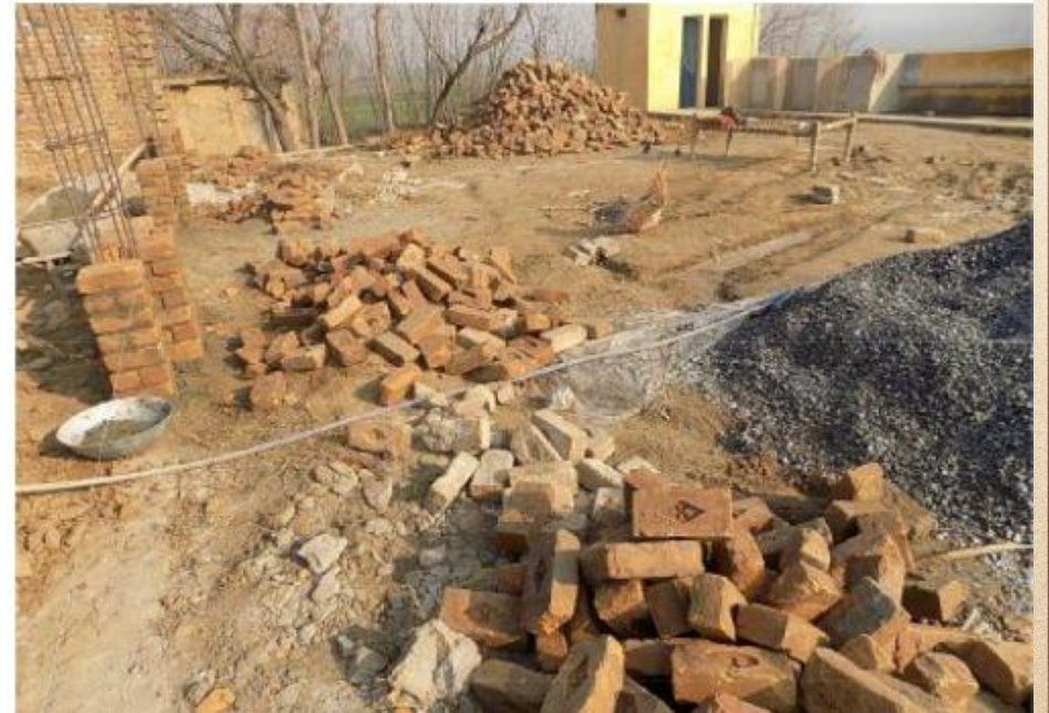
مشروع بناء بيت في الجنة / مسجد أم عبد الرحمن عفا الله عنها (١٦٥)