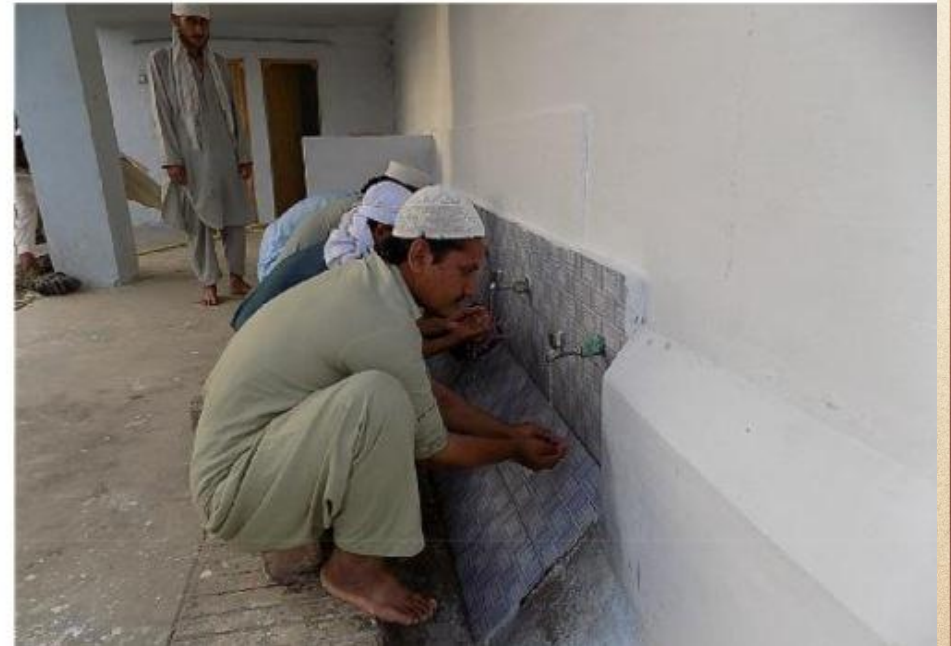
مشروع بناء بيت في الجنة / مسجد أم عبد الرحمن عفا الله عنها (١٦٥)