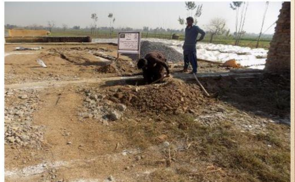
مشروع بناء بيت في الجنة / مسجد أم عبد الرحمن عفا الله عنها (١٦٥)