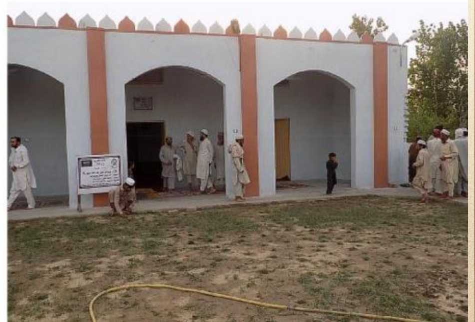
مشروع بناء بيت في الجنة / مسجد أم عبد الرحمن عفا الله عنها (١٦٥)