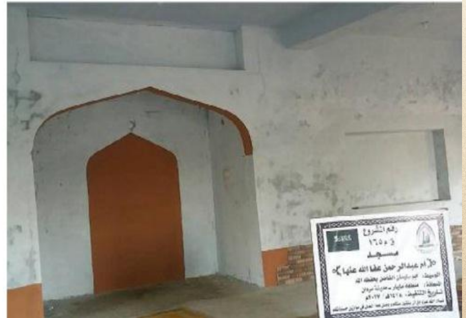
مشروع بناء بيت في الجنة / مسجد أم عبد الرحمن عفا الله عنها (١٦٥)