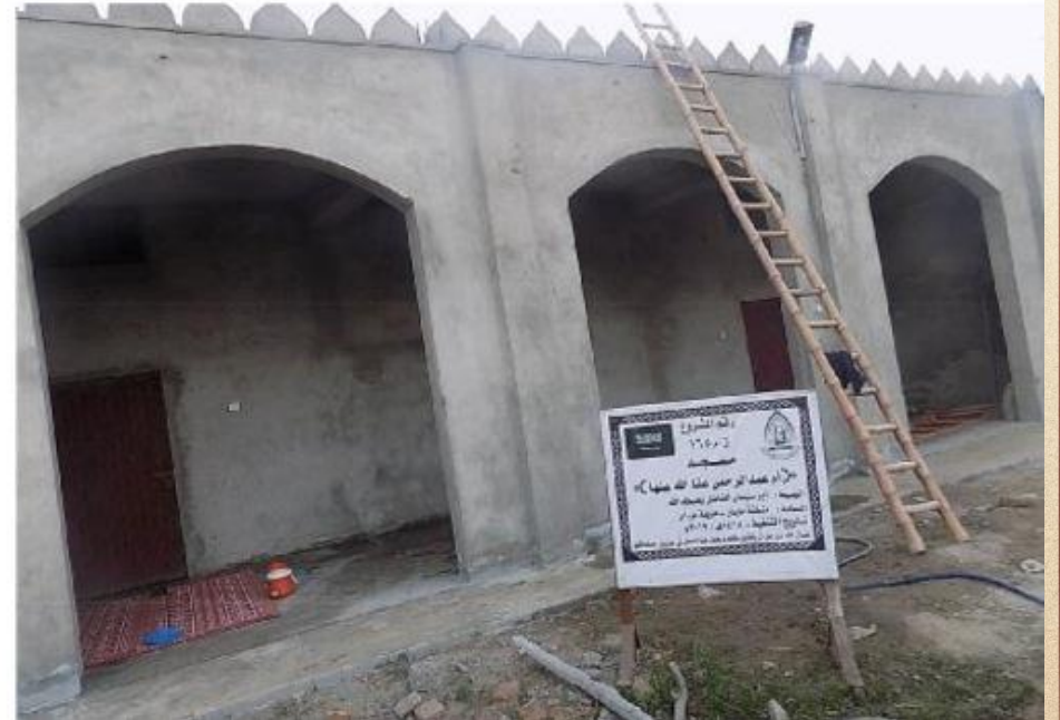
مشروع بناء بيت في الجنة / مسجد أم عبد الرحمن عفا الله عنها (١٦٥)