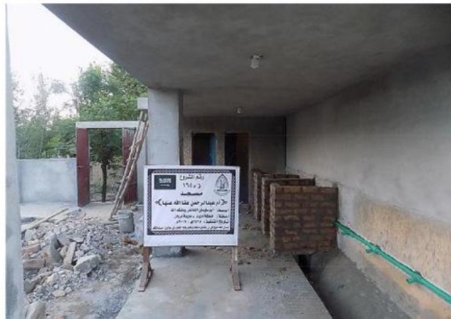
مشروع بناء بيت في الجنة / مسجد أم عبد الرحمن عفا الله عنها (١٦٥)