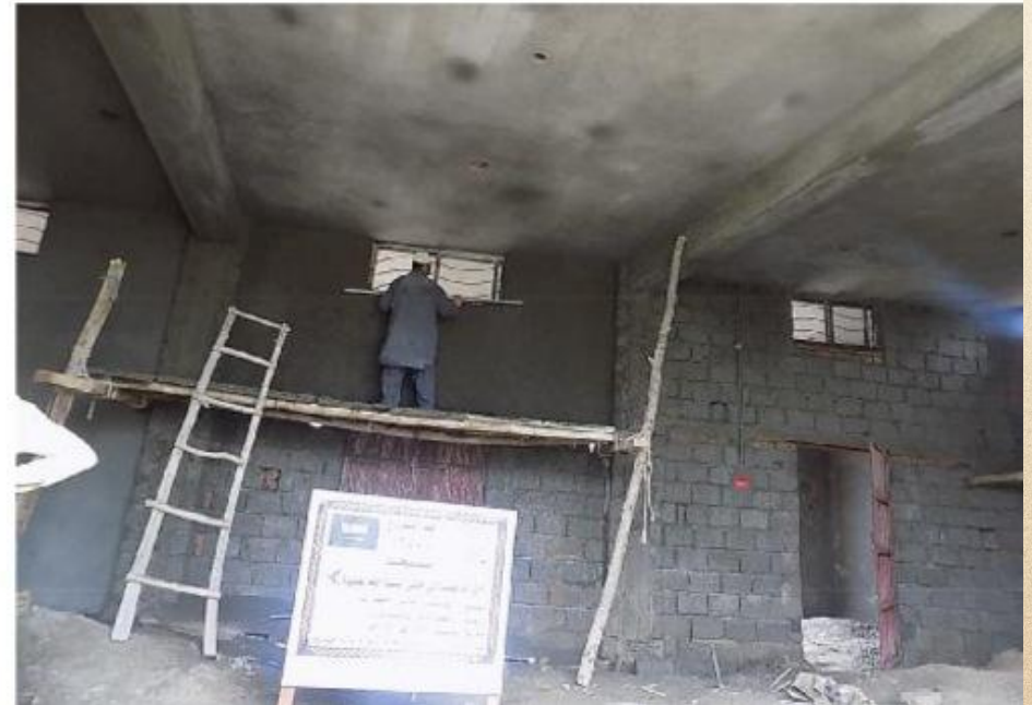
مشروع بناء بيت في الجنة / مسجد أم عبد الرحمن عفا الله عنها (١٦٥)