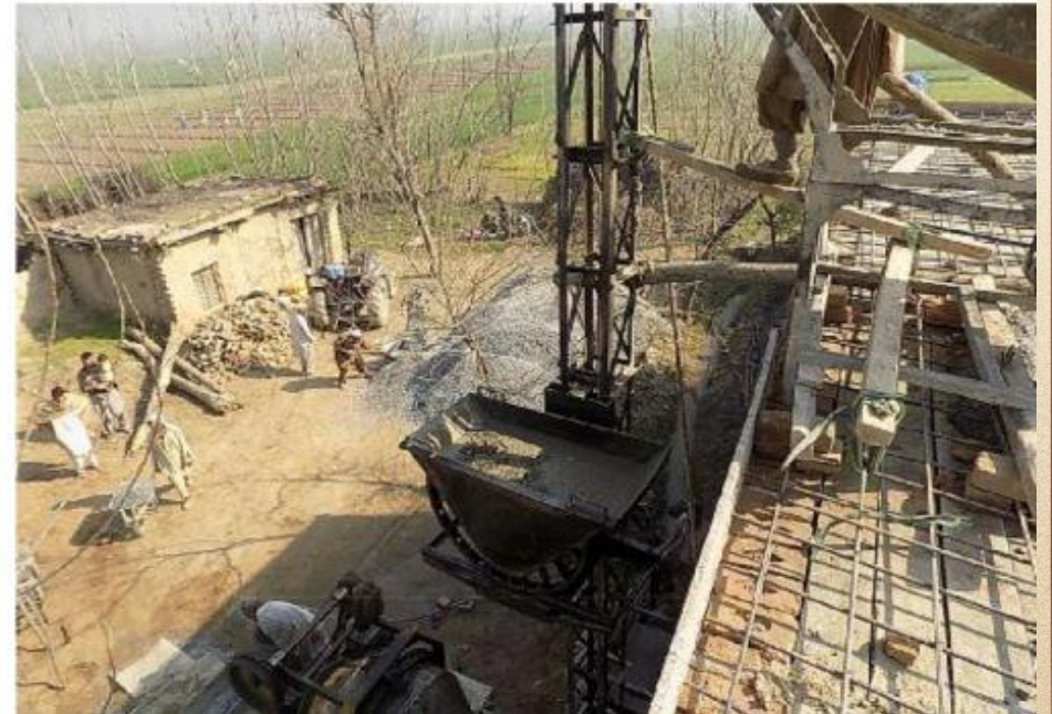
مشروع بناء بيت في الجنة / مسجد أم عبد الرحمن عفا الله عنها (١٦٥)