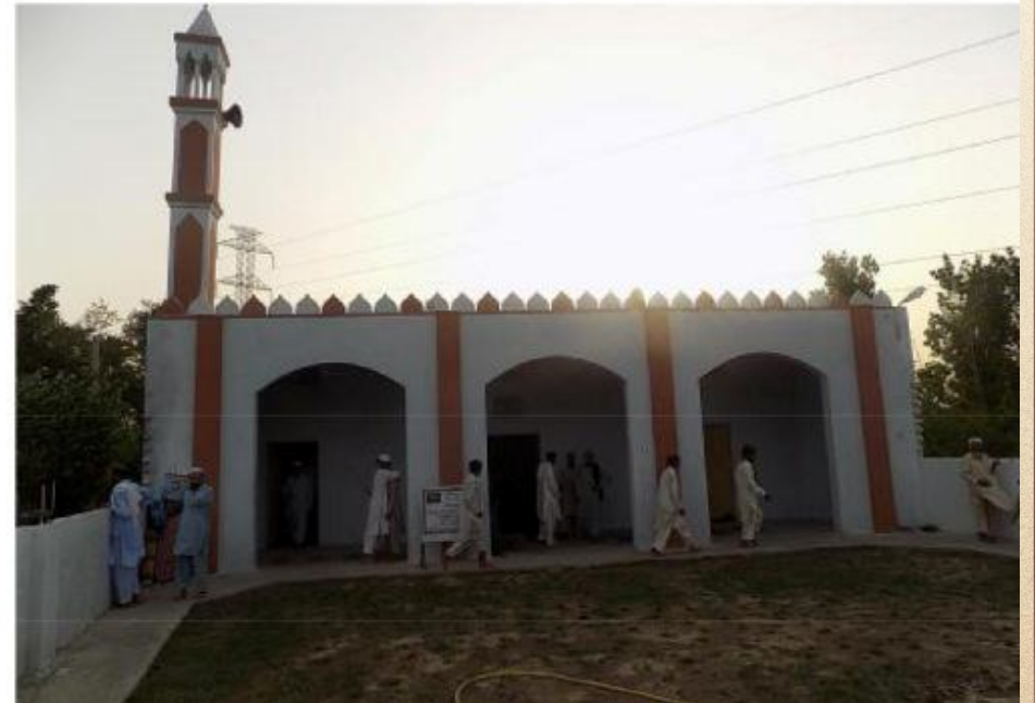
مشروع بناء بيت في الجنة / مسجد أم عبد الرحمن عفا الله عنها (١٦٥)