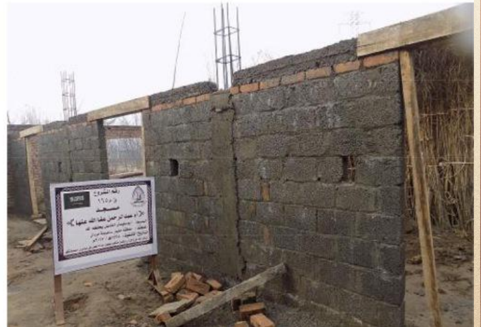
مشروع بناء بيت في الجنة / مسجد أم عبد الرحمن عفا الله عنها (١٦٥)