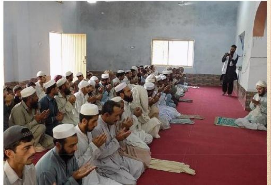
مشروع بناء بيت في الجنة / مسجد أم عبد الرحمن عفا الله عنها (١٦٥)