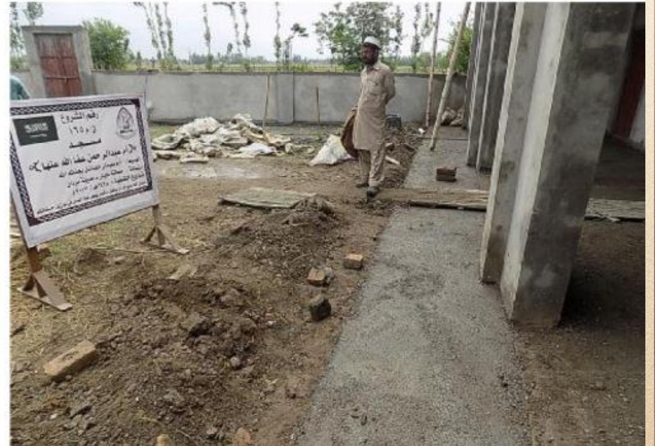
مشروع بناء بيت في الجنة / مسجد أم عبد الرحمن عفا الله عنها (١٦٥)