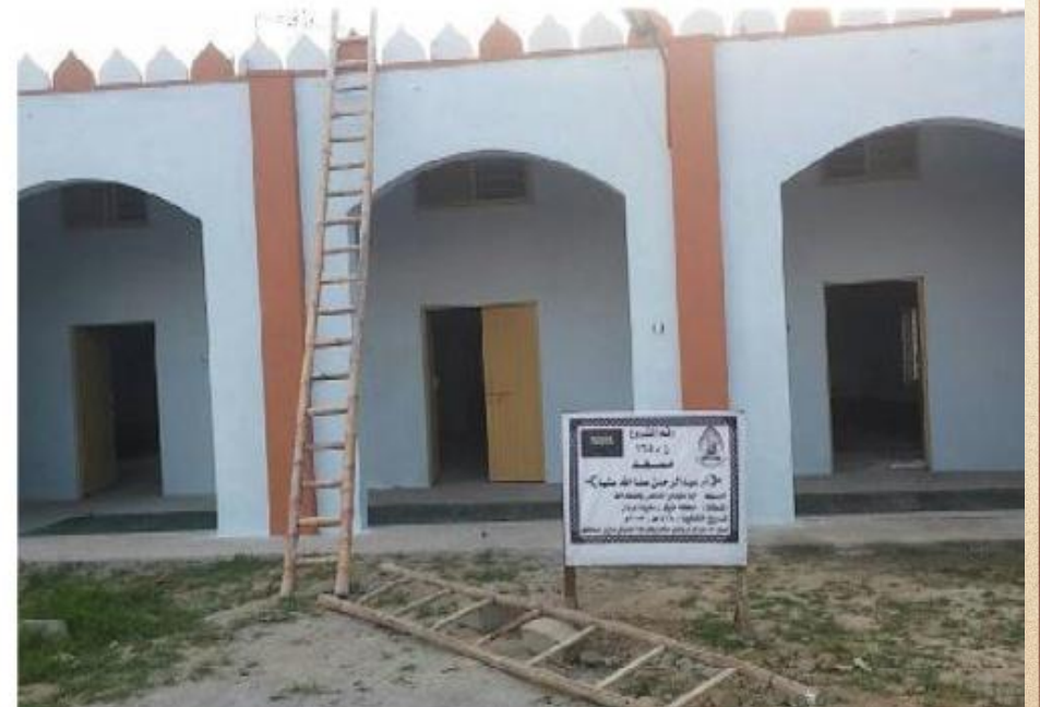
مشروع بناء بيت في الجنة / مسجد أم عبد الرحمن عفا الله عنها (١٦٥)