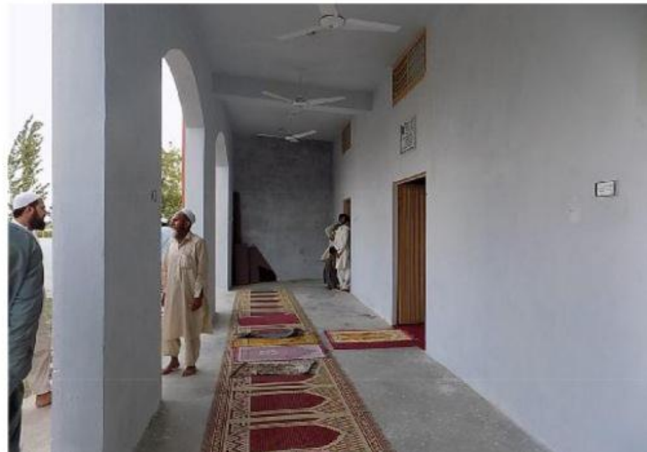
مشروع بناء بيت في الجنة / مسجد أم عبد الرحمن عفا الله عنها (١٦٥)