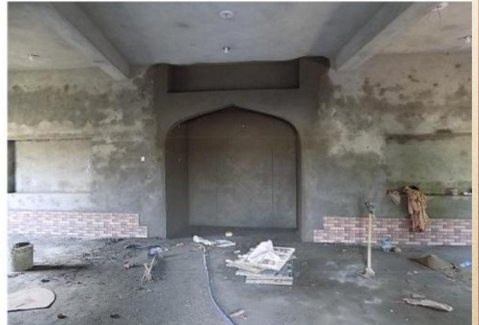
مشروع بناء بيت في الجنة / مسجد أم عبد الرحمن عفا الله عنها (١٦٥)