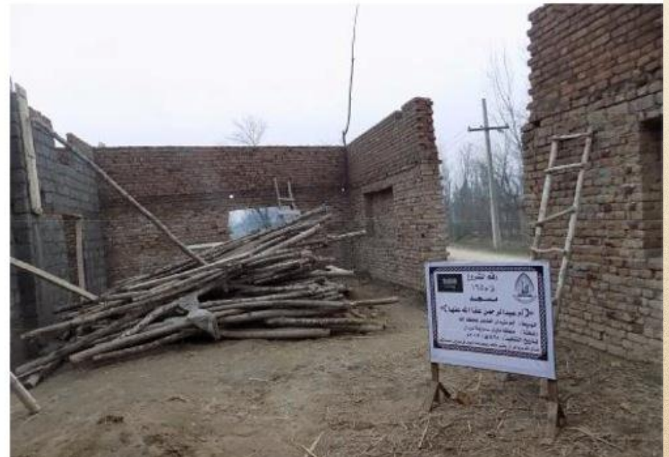
مشروع بناء بيت في الجنة / مسجد أم عبد الرحمن عفا الله عنها (١٦٥)