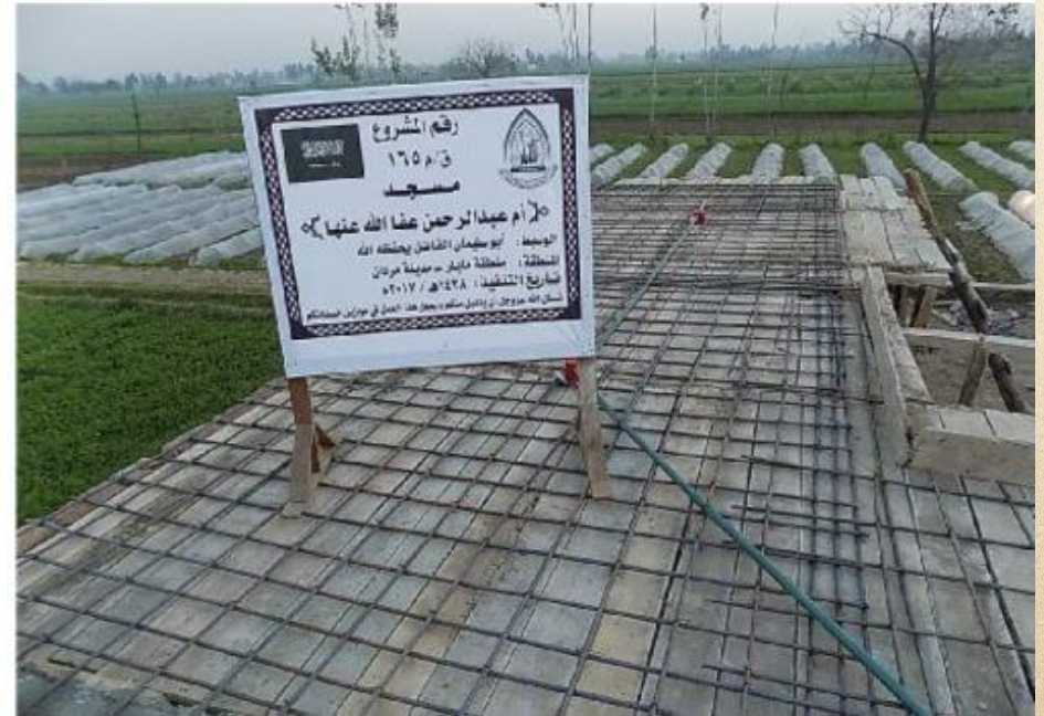
مشروع بناء بيت في الجنة / مسجد أم عبد الرحمن عفا الله عنها (١٦٥)