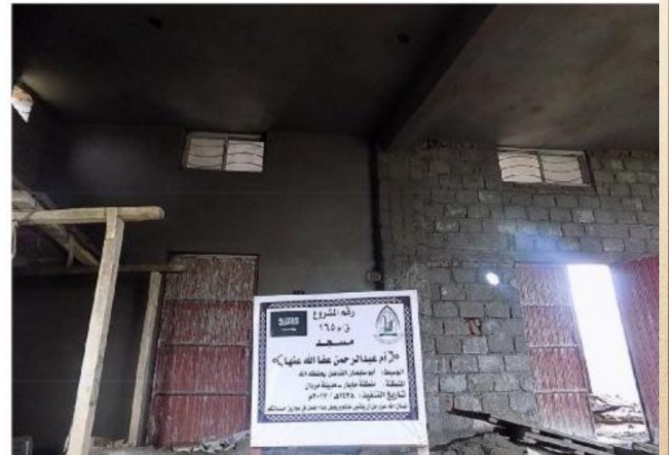
مشروع بناء بيت في الجنة / مسجد أم عبد الرحمن عفا الله عنها (١٦٥)