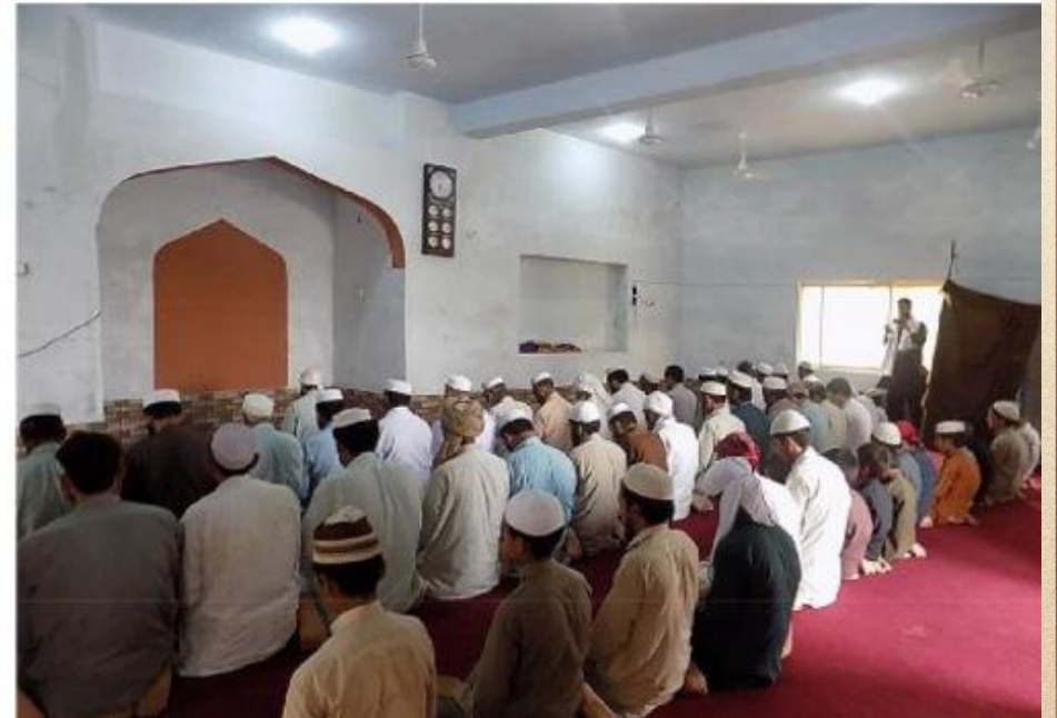
مشروع بناء بيت في الجنة / مسجد أم عبد الرحمن عفا الله عنها (١٦٥)