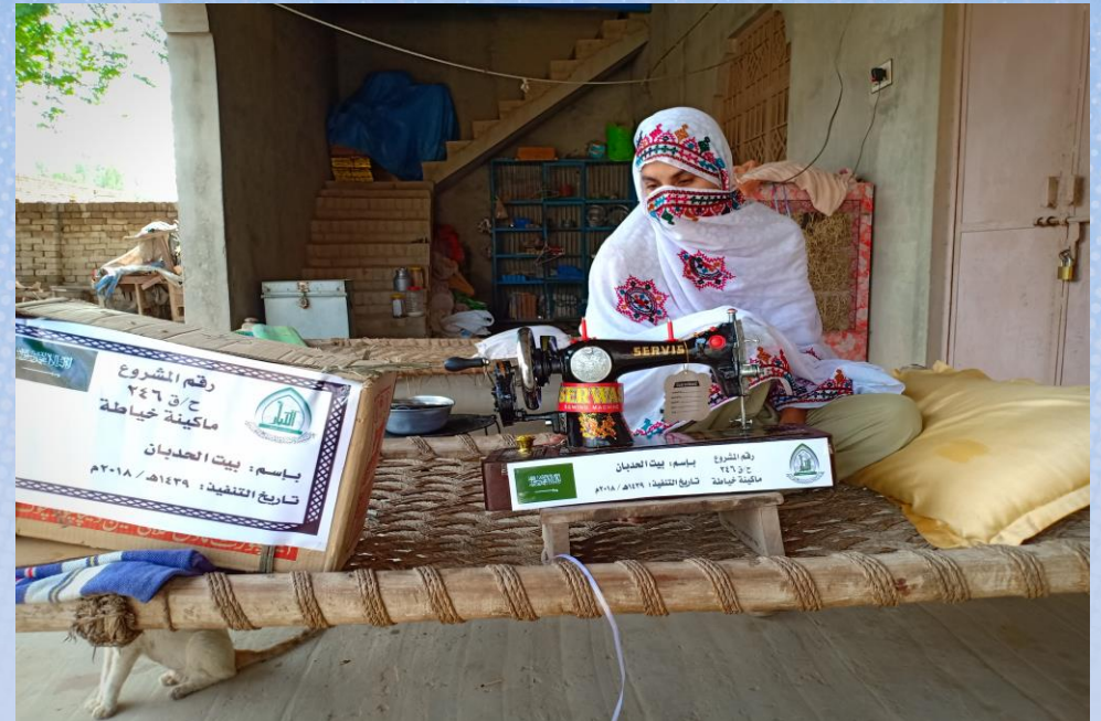
تقرير ختامي مشروع ماكينة خياطة باسم / بيت الحدبان (م/ق ٢٤٦)