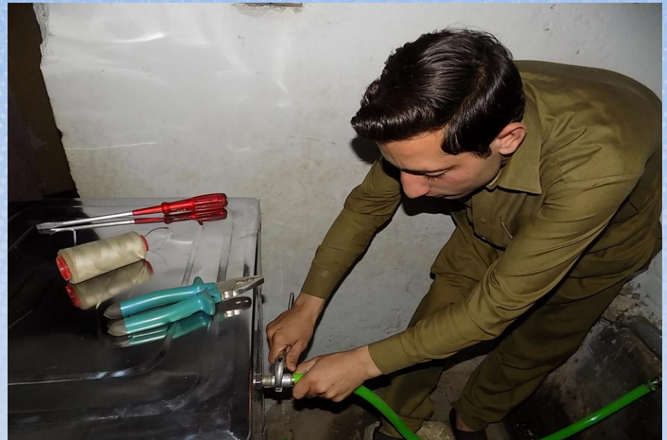
تقریر ختامي مشروع برادۃ ماء وقف لمسجد باسم / فاعل خير (۳) (ق/م ۱۴۷)