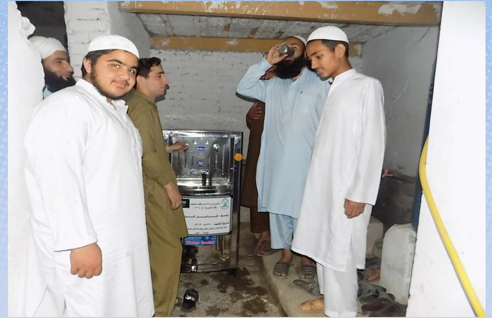
تقرير ختامي مشروع برادة ماء وقف لمسجد باسم / فاعل خير (٢) (ق/م ١٢٧)