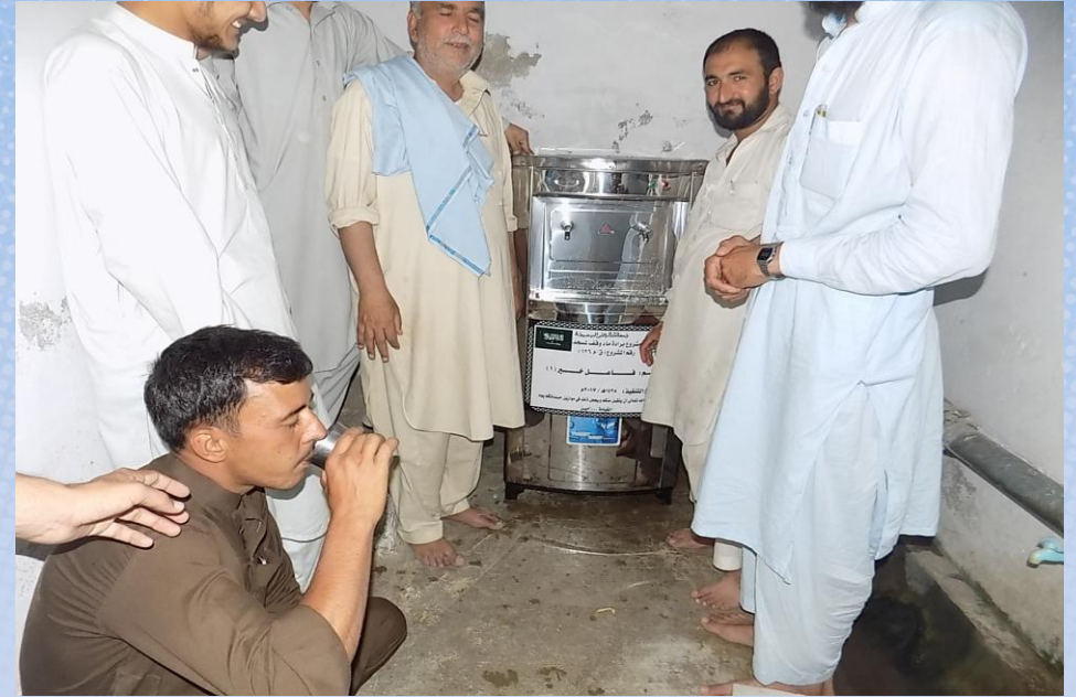
تقرير ختامي مشروع برادة ماء وقف لمسجد باسم / فاعل خير (١) (ق/م ١٢٦)