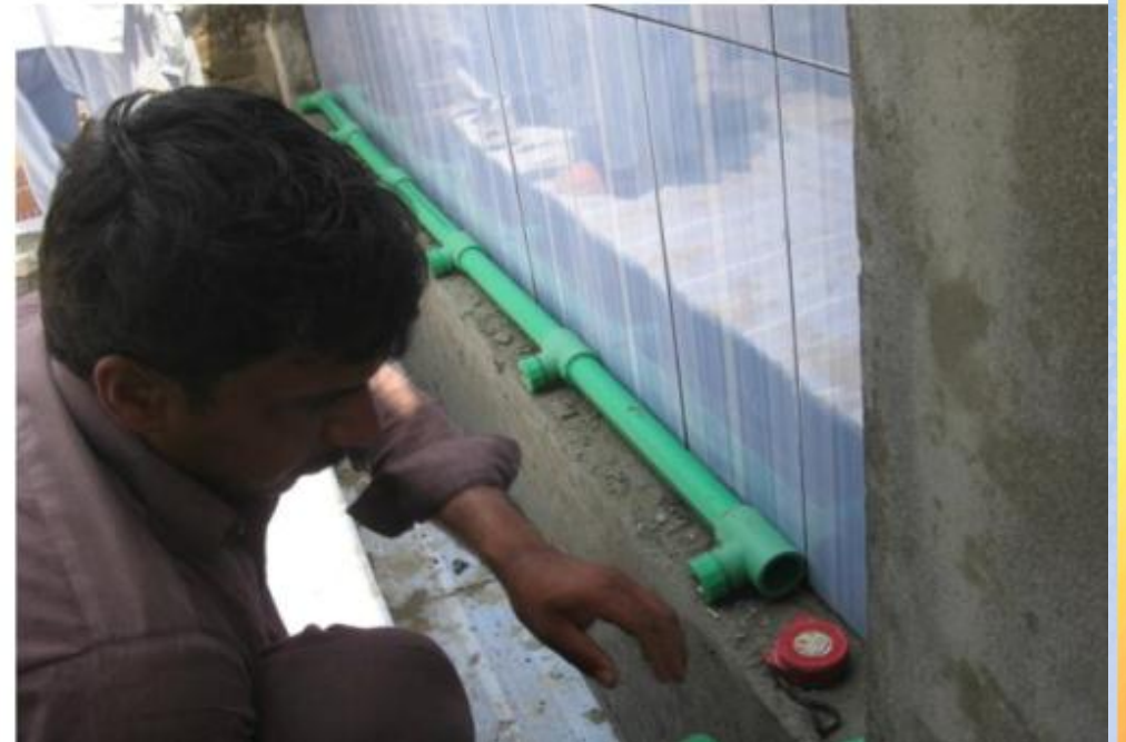
تقرير ختامي حفر بئر باسم / المغفور له بإذن الله جابر عبدالرحمن الشمراني (٣) (ق/م ك ٥٠٠٣)