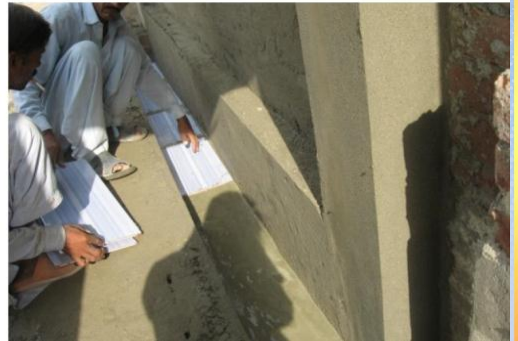
تقریر ختامي حفر بئر باسم / المغفور له باذن الله جابر عبدالرحمن الشمراني (٣) (ق/م ك ٥٠٠٣)