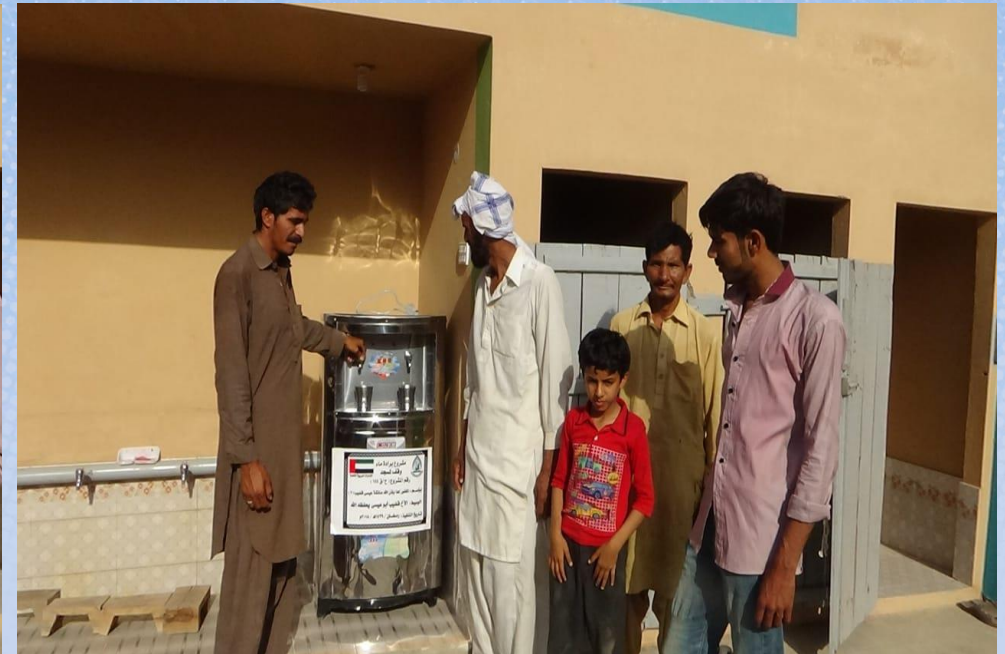
تقرير ختامي مشروع براءة ماء وقف لمسجد باسم / المغفور لها بادن الله عائشة عيسى قضيبي (٣) (د/ق ١٤٤)