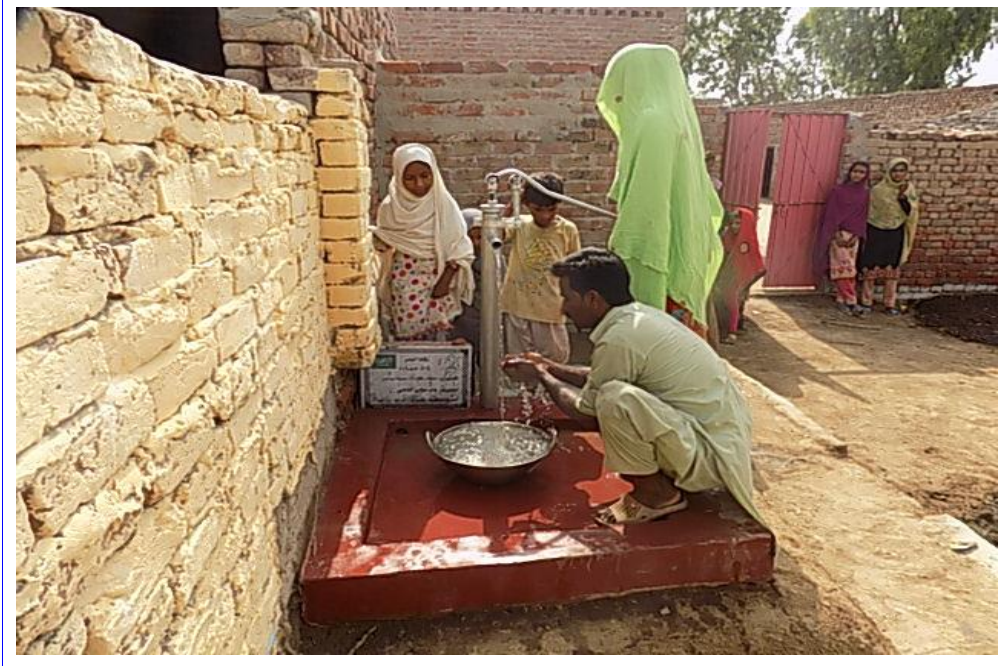
صورة أخرى للبئر مع المستخدمين من المشروع وهم يتوضئون من ماء البئر