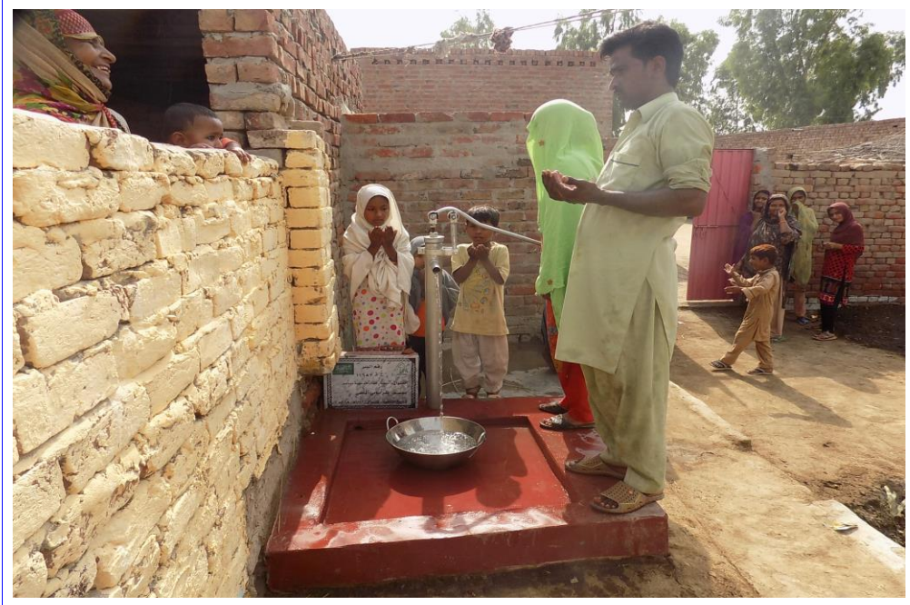
صورة أخرى للبئر مع المستخدمين من المشروع وهم يدعون للمتبرع بالتوفيق والقبول