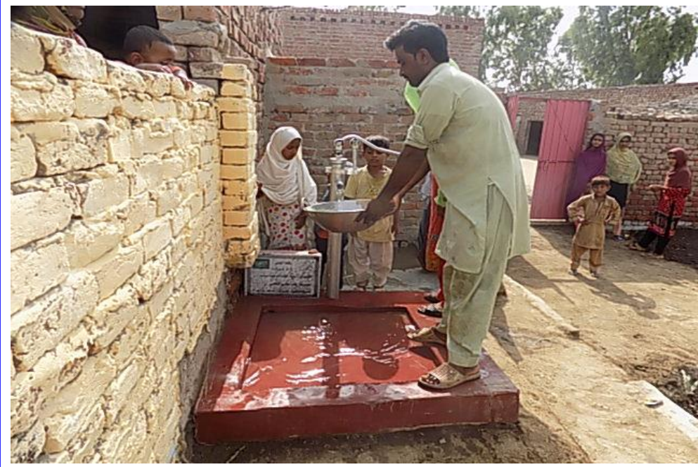
صورة أخرى للبئر مع المستفيدين من المشروع وهم يعيئون أو انيهم من ماء البئر