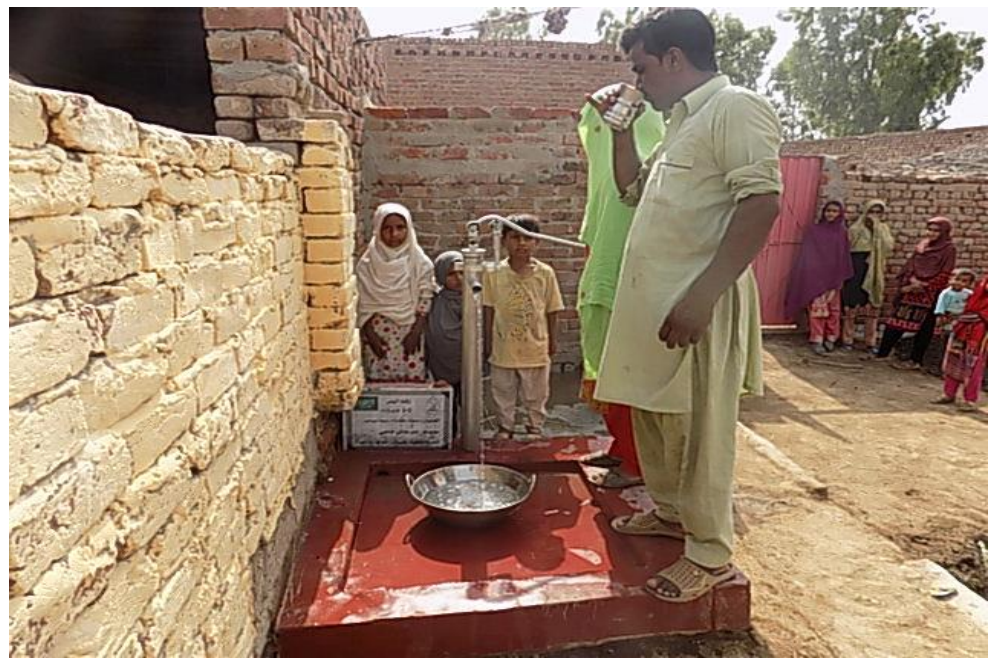
صورة للبئر مع المستفيدين من المشروع وهم يشربون من ماء البئر