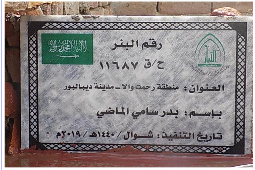
صورة عن قرب للوحة