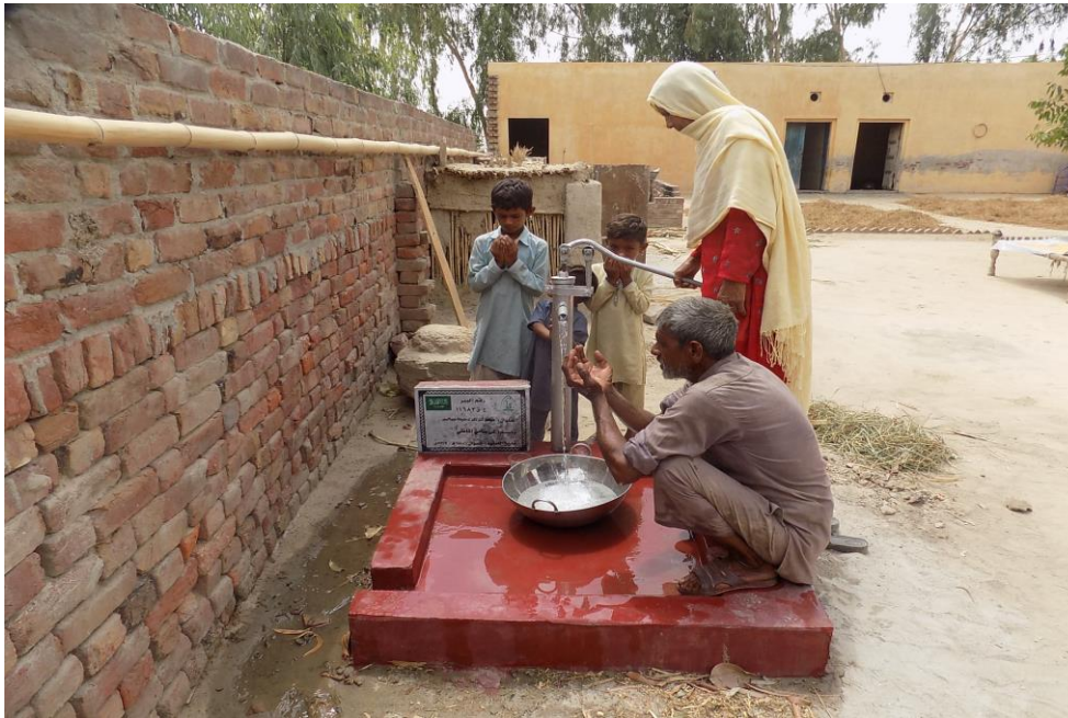
صورة أخرى للبئر مع المستفيدين من المشروع وهم يدعون للمتبرعة بالتوفيق والقبول