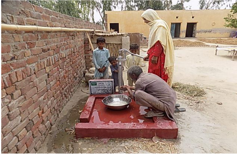
صورة أخرى للبئر مع المستفيدين من المشروع وهم يتوضئون من ماء البئر