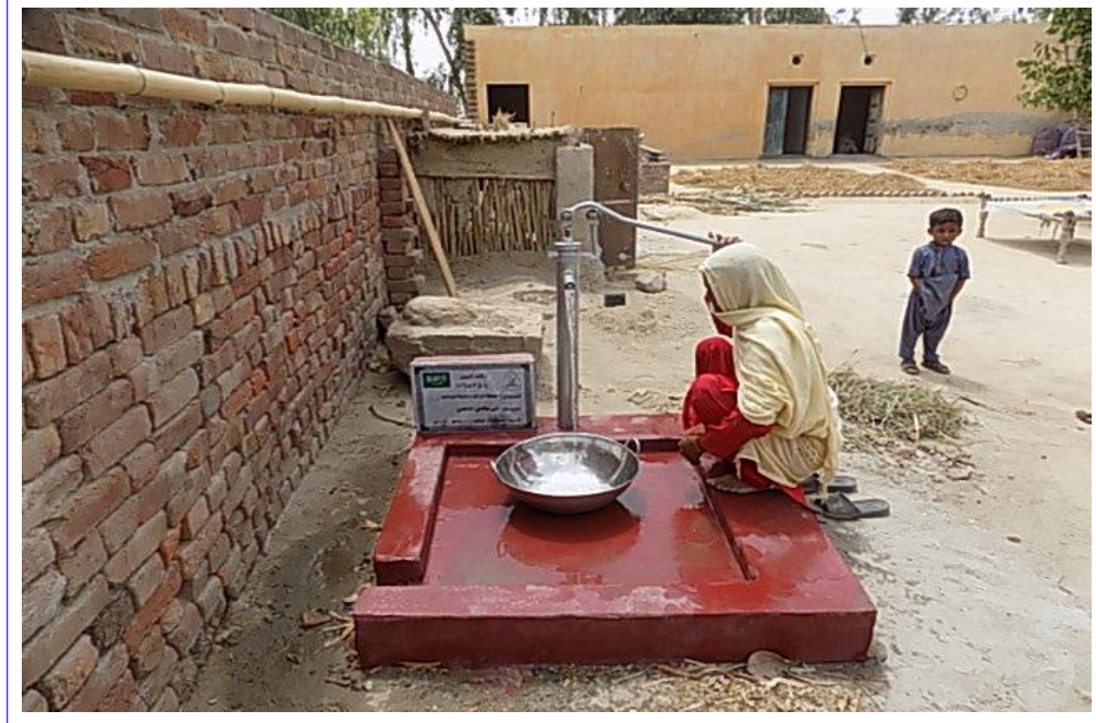
صورة عن قرب للبئر مع اللوحة