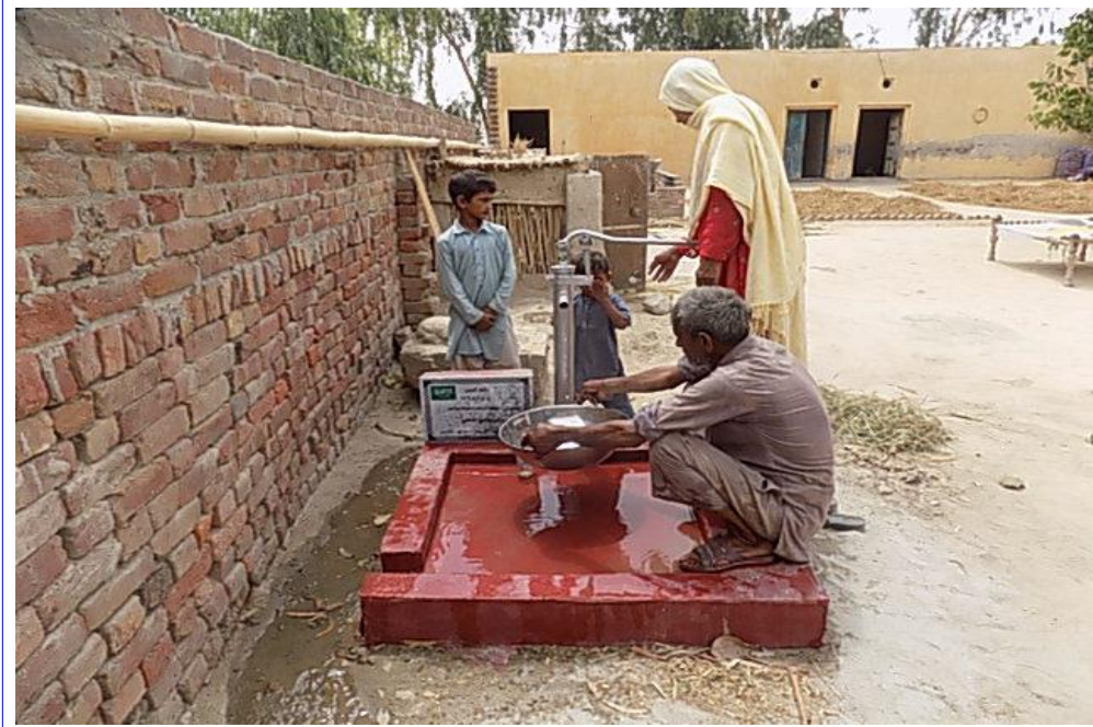
صورة أخرى للبئر مع المستفيدين من المشروع وهم يعيئون أو انيهم من ماء البئر