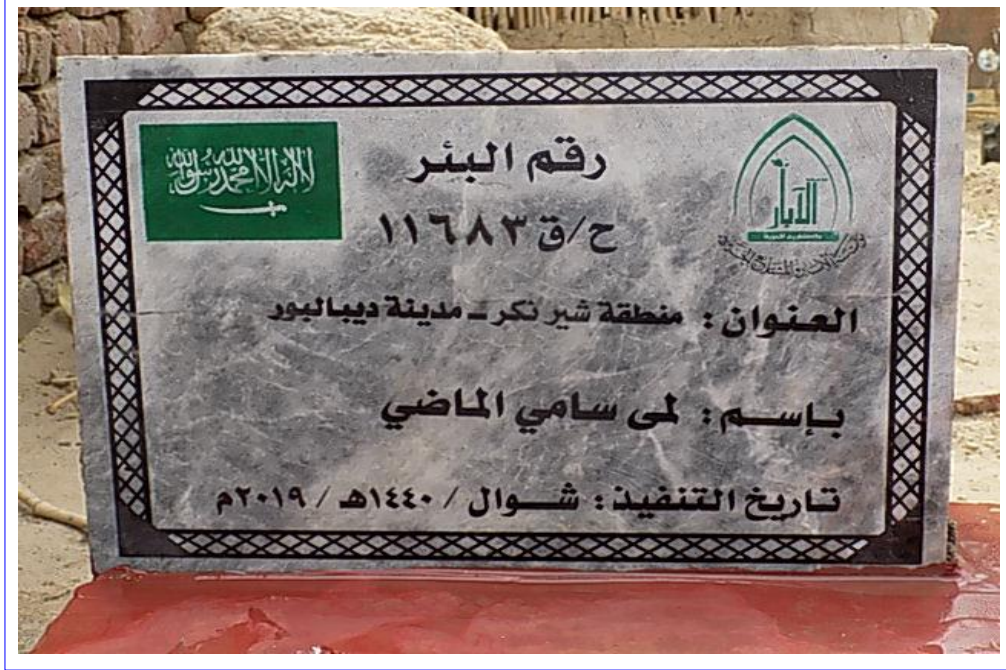
صورة عن قرب للوحة