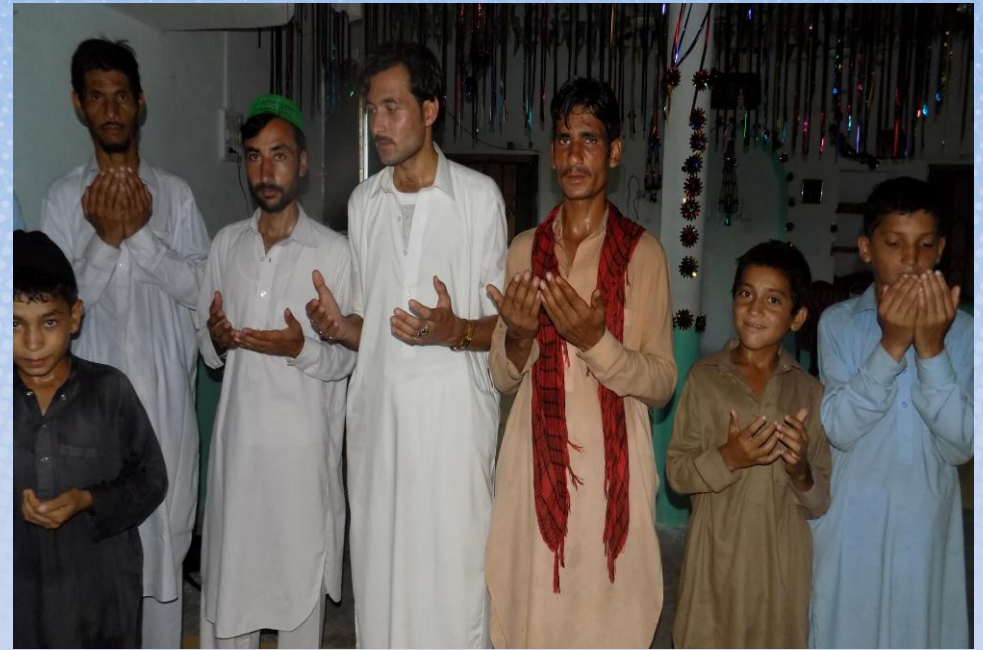
تقرير ختامي مشروع برادة ماء وقف لمسجد باسم / سكيته نزال المسيب (ق/م ١١٦)