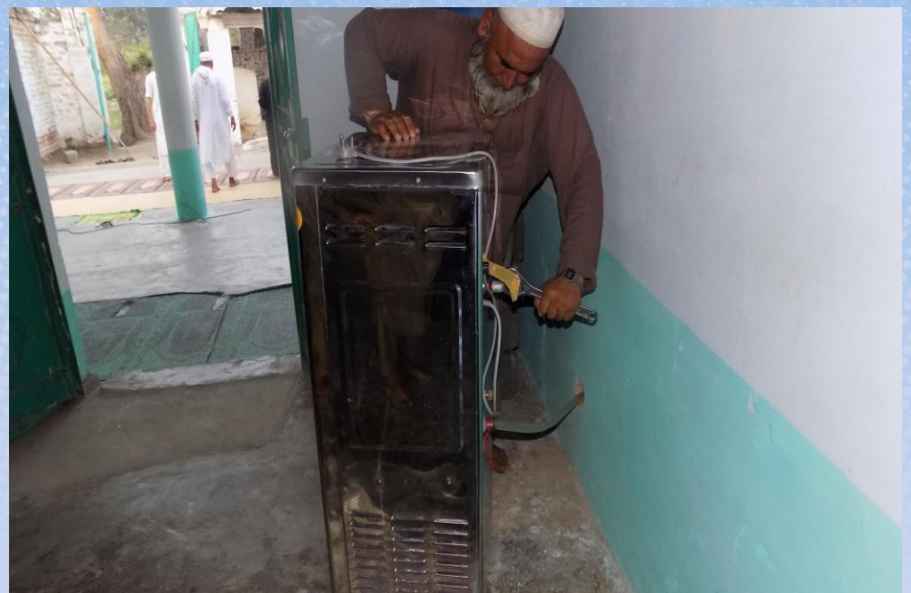
تقرير ختامي مشروع برادة ماء وقف لمسجد باسم / سكيته نزال المسيب (ق/م ١١٦)