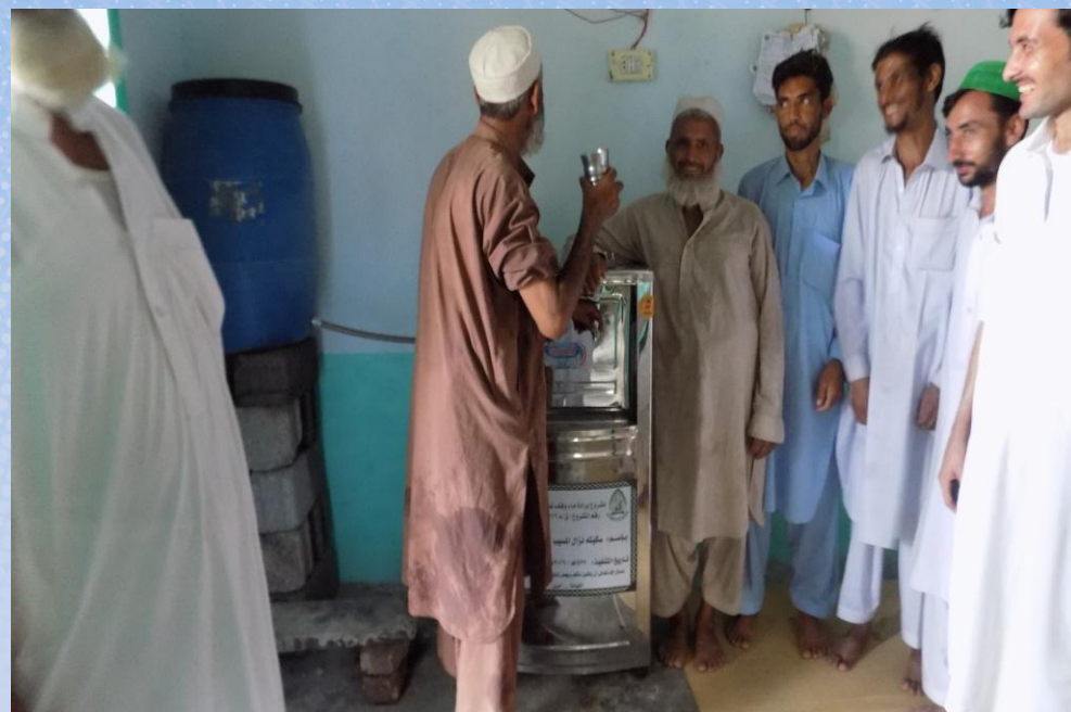
تقرير ختامي مشروع برادة ماء وقف لمسجد باسم / سكيته نزال المسيب (ق/م ١١٦)