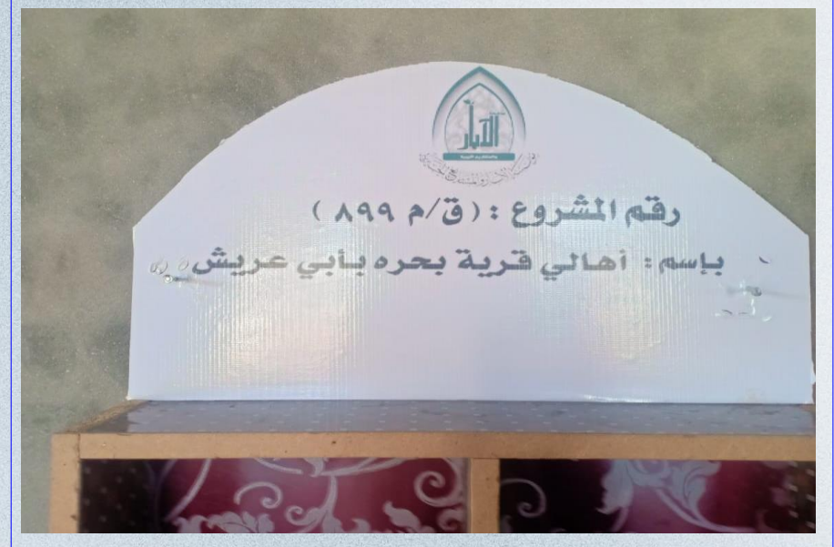
صورة عن قرب لدولاب المصاحف