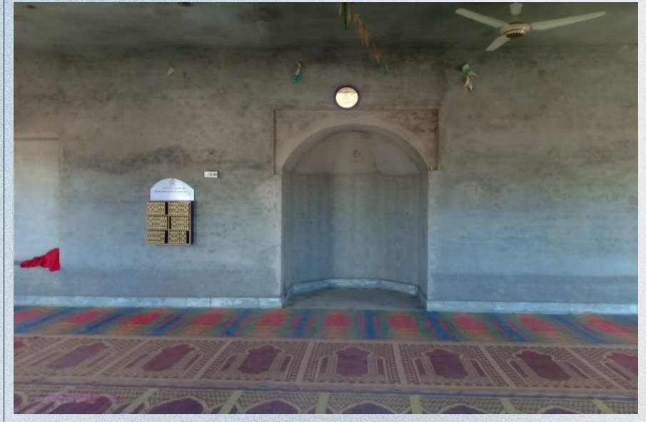
صورة لدولاب المصاحف من داخل مصلى المسجد