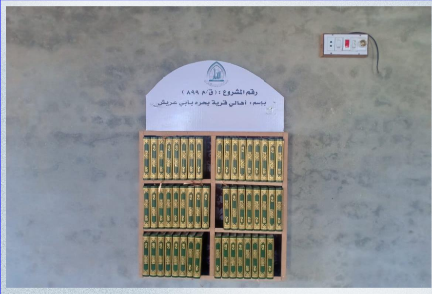
صورة لدولاب المصاحف من داخل مصلى المسجد

تقرير مشروع نشر كتاب الله تعالى باسم / أهالي قرية بحره بأبي عريش (م/ق ٨٩٩)