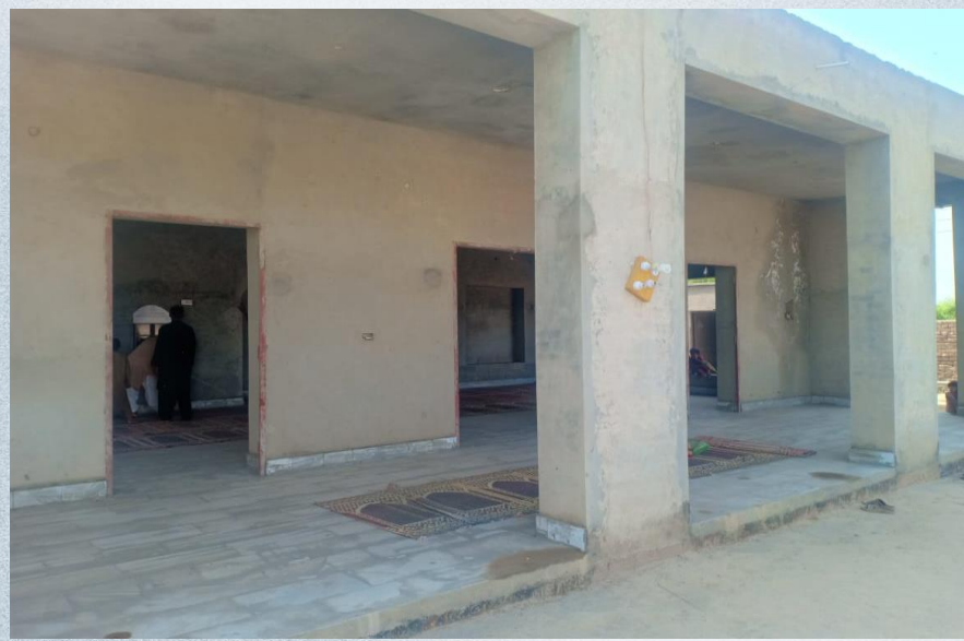
صورة للمسجد من الخارج

تقرير مشروع نشر كتاب الله تعالى باسم / أهالي قرية بحره بأبي عريش (م/ق ٨٩٩)