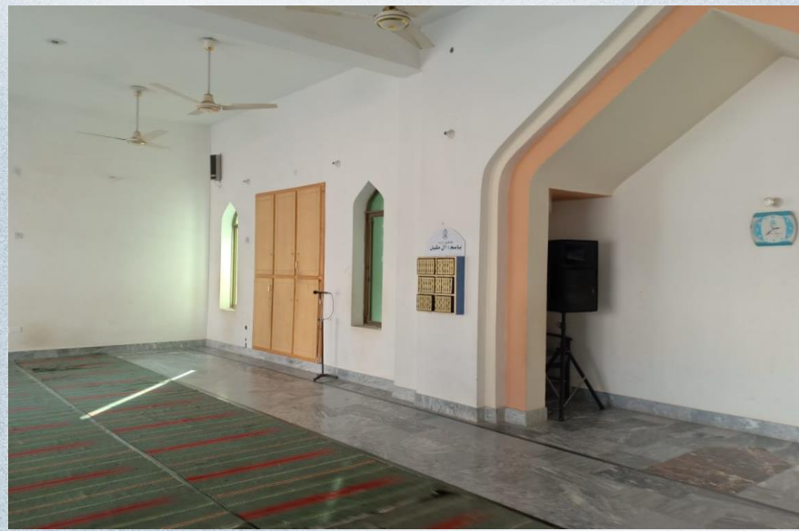
صورة للمسجد من الخارج

تقرير مشروع نشر كتاب الله تعالى باسم / آل مقبل (ح/ق ٨٩٥)