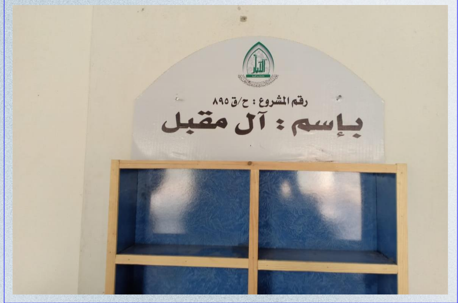
صورة عن قرب لدولاب المصاحف