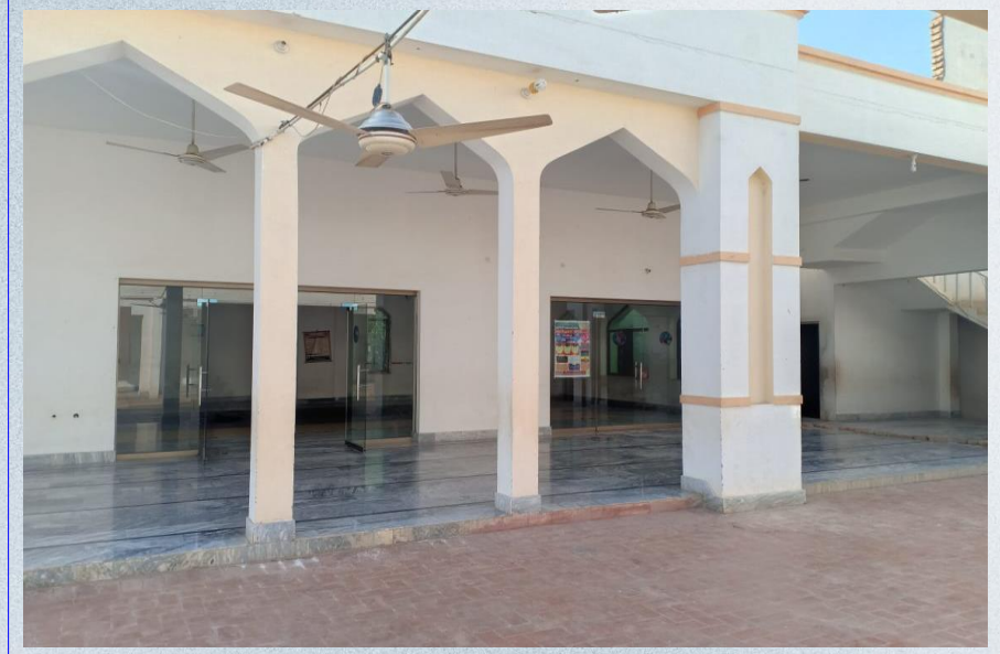
صورة لدولاب المصاحف من داخل مصلى المسجد