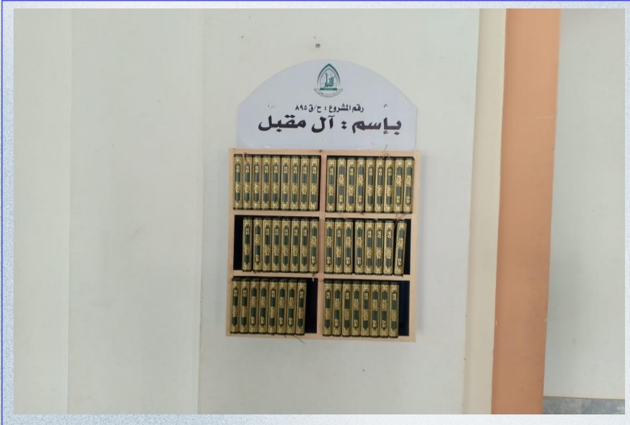
صورة لدولاب المصاحف من داخل مصلى المسجد

تقرير مشروع نشر كتاب الله تعالى بإسم / آل مقبل (ح/ق ٨٩٥)