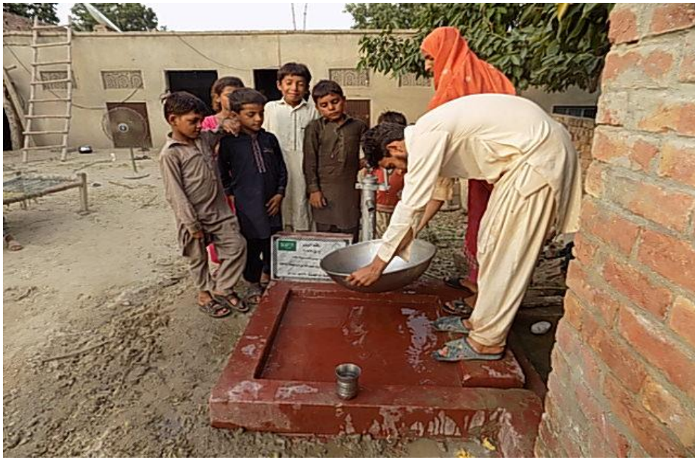
صورة أخرى للبئر مع المستفيدين من المشروع وهم يعيئون أو انيهم من ماء البئر