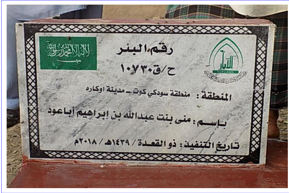
صورة عن قرب للوحة