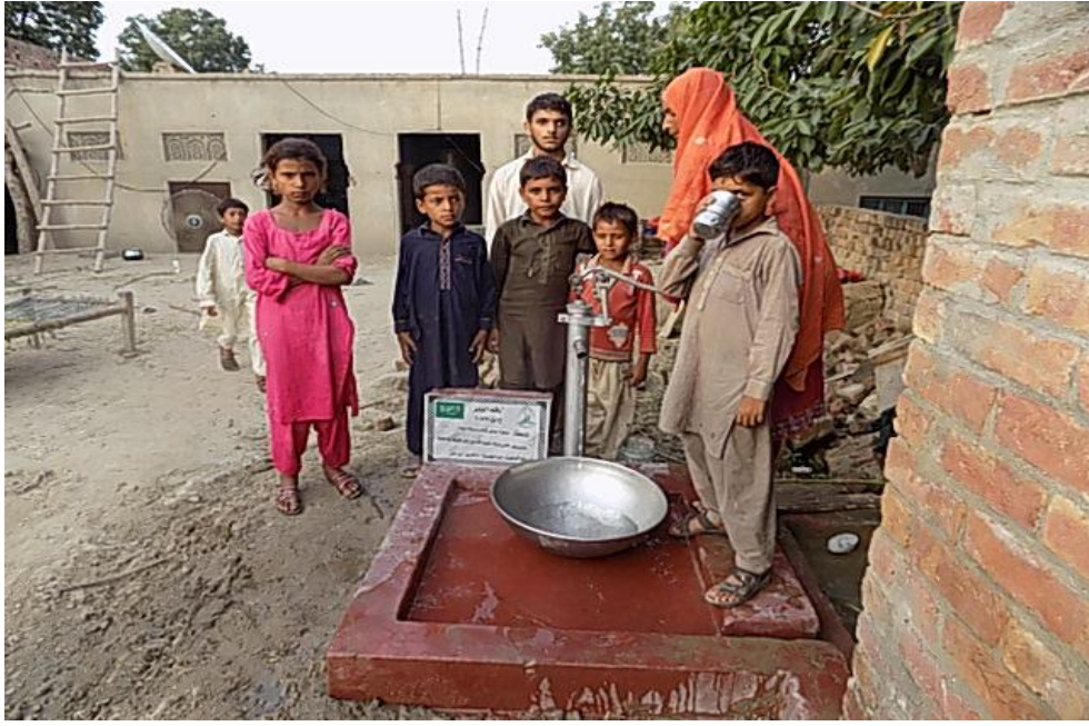
صورة للبئر مع المستفيدين من المشروع وهم يشربون من ماء البئر