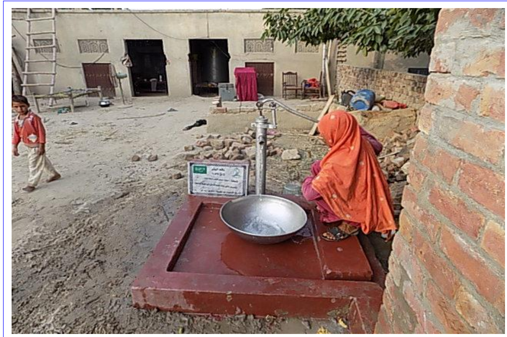
صورة عن قرب للبئر مع اللوحة