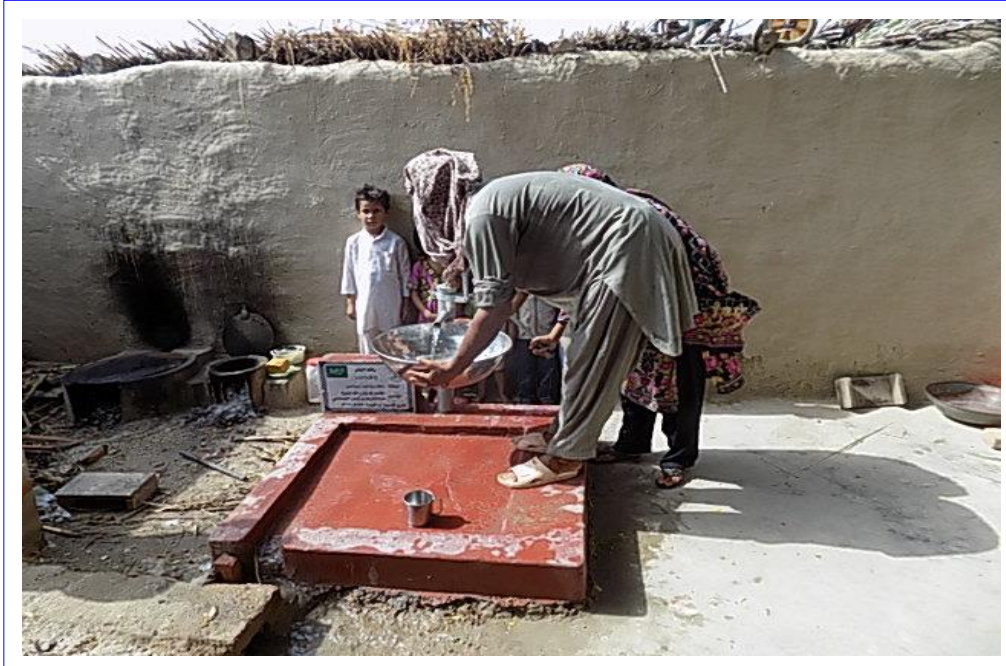
صورة أخرى للبئر مع المستفيدين من المشروع وهم يعيئون أو انيهم من ماء البئر