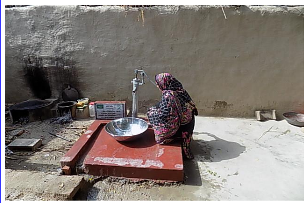
صورة عن قرب للبئر مع اللوحة