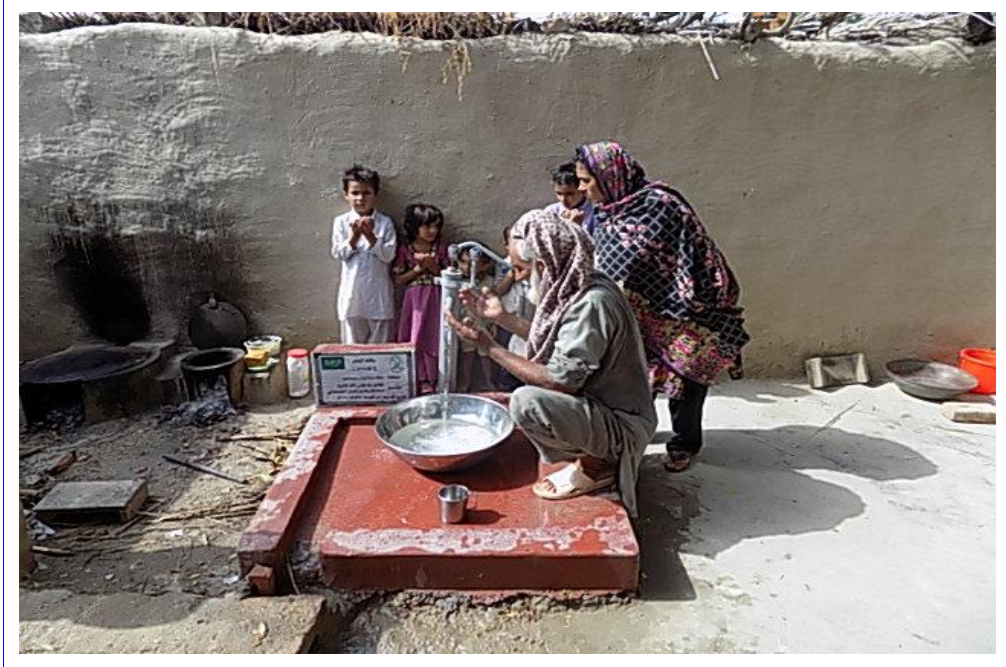
صورة أخرى للبئر مع المستفيدين من المشروع وهم يدعون للمرحوم بإذن الله بالمغفرة والرحمة