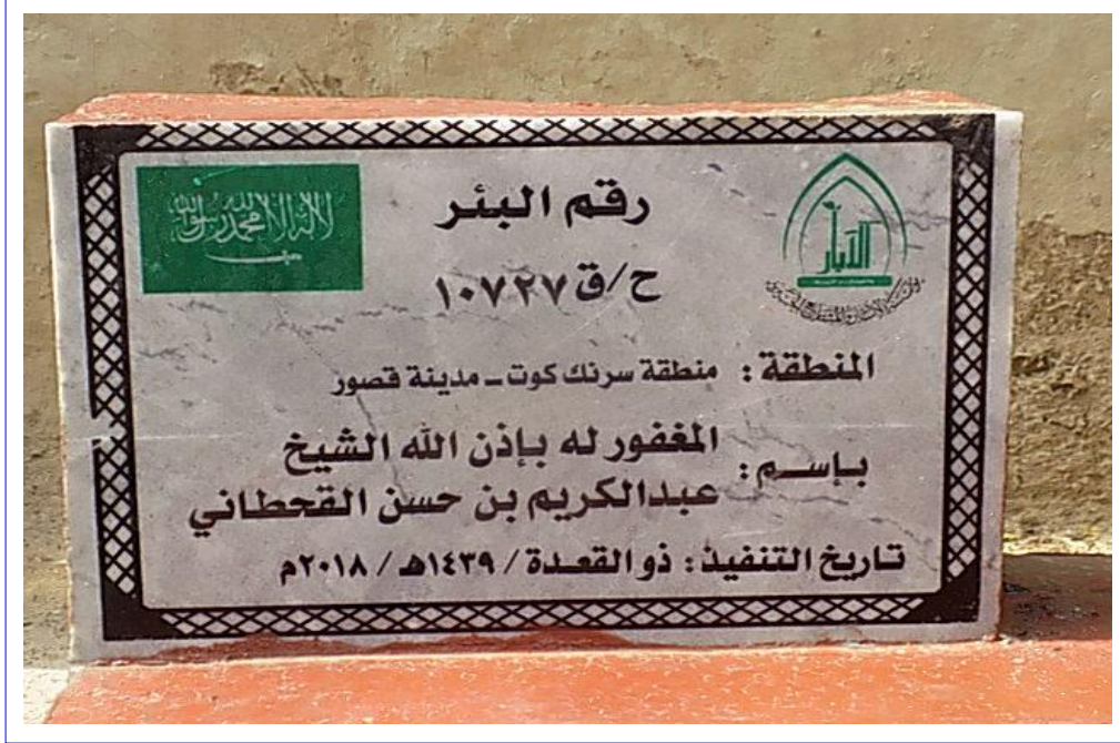
صورة عن قرب للوحة