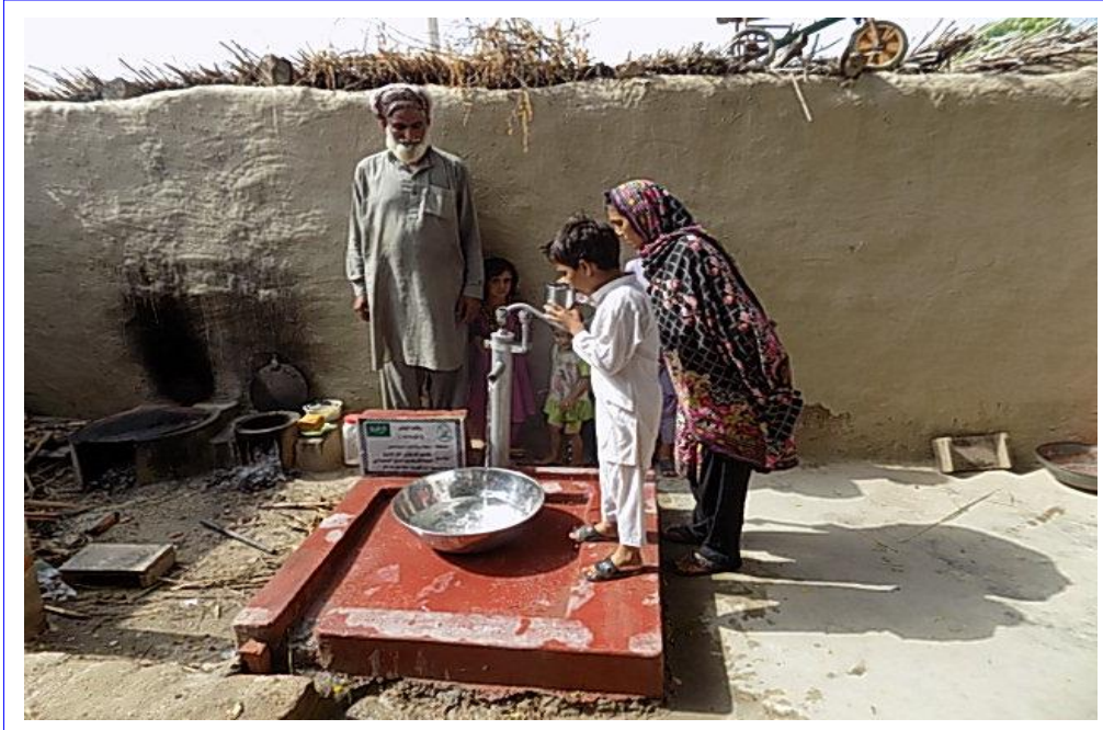
صورة للبئر مع المستفيدين من المشروع وهم يشربون من ماء البئر