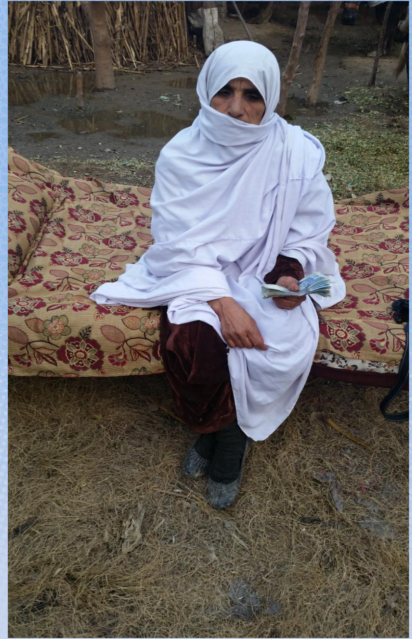
تقرير ختامی مشروع كفالة أرملة صاحبة عائلة باسم / فاعل خير (٢) (٥٣٠)