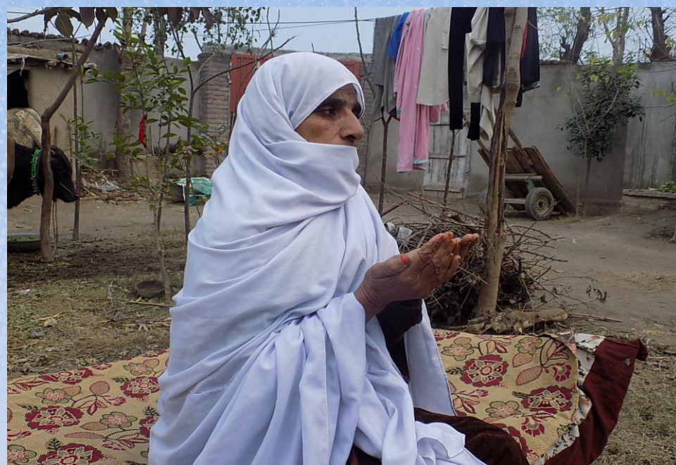
تقرير ختامى مشروع كفالة أرملة صاحبة عائلة باسم / فاعل خير (٢) (٥٣٠)