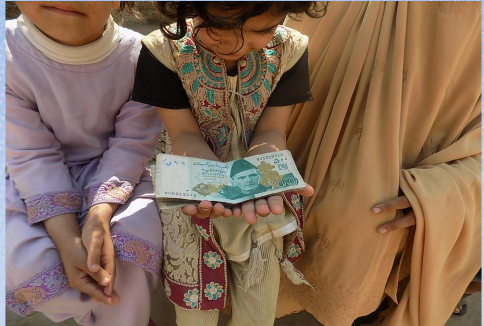
تقرير ختامي مشروع كفالة أرملة صاحبة عائلة باسم / فاعلة خير (٥٣٤)